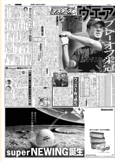
ブリヂストンスポーツ株式会社 2003年4月15日付

ゴルフはデータのスポーツとも言われています。スポニチでは、他の追随を許さない大量のデータを掘り下げ、突き詰めて記事にしています。さらに、各選手の心情、競技中の心理状態などを交えて分かりやすくお伝えしたいと思います。スポニチならではのデータ解析ならお任せください。