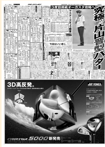
ヨネックス株式会社 2003年4月10日付

最新のゴルフ用品も出そろいゴルファー気分が一気に盛り上がってくる4月、ゴルファーの皆様に弊社の新商品を広く認知していただくため、ゴルファーが最も注目するゴルフの祭典『マスターズ・トーナメント』最終日にあわせて出稿いたしました。 (ブリヂストンスポーツ株式会社 マーケティング部 宣伝グループ)