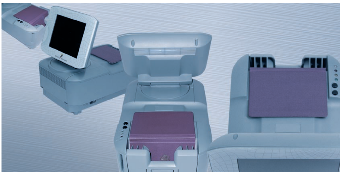
▶ VISOTEC ePass-Lesegerät

Grundsätzlich werden alle aktuellen gesetzlichen Änderungen in den von der Bundesdruckerei bereit gestellten Software-Updates berücksichtigt und sind über das unternehmenseigene Service-Portal erhältlich. ◀