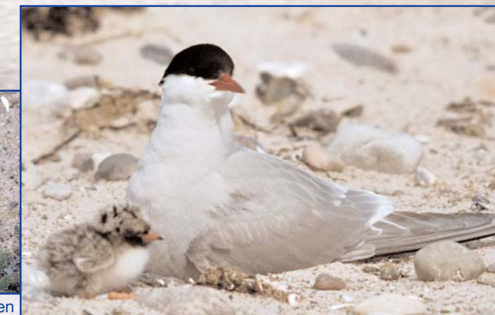
Küstenseeschwalbe mit Küken

Antworten auf die Frage nach der Herkunft der Vögel haben Kontrollen von beringten Alpenstrandläufern gegeben, die aus Norwegen (3), Schweden (17), Finnland (5), Polen (26) und Russland/Sibirien (2) stammten; Ein junger Knutt war auf der Taimyr-Halbinsel/Sibirien beringt worden.