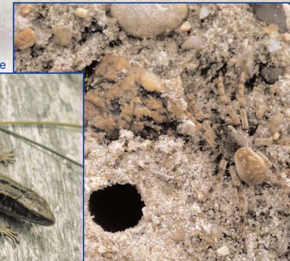
Meerstrand-Wolfsspinne neben Wohnhöhle