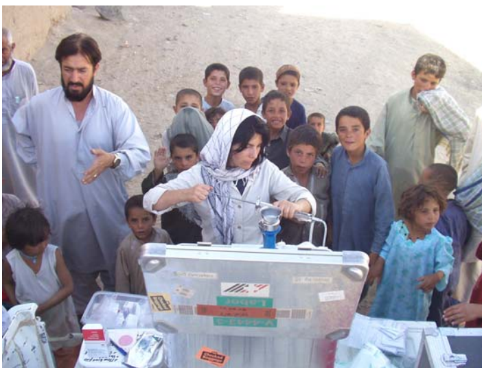
Trinkwasseranalyse mit dem SKH-Feldlabor durch die Expertin aus dem LABOR SPIEZ.

In den Städten Kandahar, Kabul, Herat und Mazar-e-Sharif wurde die Belastung des Trinkwassers durch Bakterien mit dem mobilen Feldlabor des Schweizerischen Korps für Humanitäre Hilfe (SKH) vor Ort gemessen. Weiter wurden Proben zur Messung der Kontamination des Wassers durch Öl und Chemikalien erhoben, welche später im LABOR SPIEZ analysiert wurden.