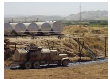
Boden- und Grundwasserbelastung, Öltraffinerie in Mazar-e-Sharif.