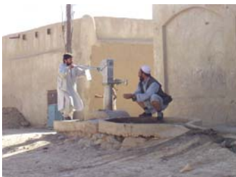
Brunnen in Kandahar.

um eine Übersicht der Umweltbelastung nach der langjährigen Kriegszeit zu erhalten.