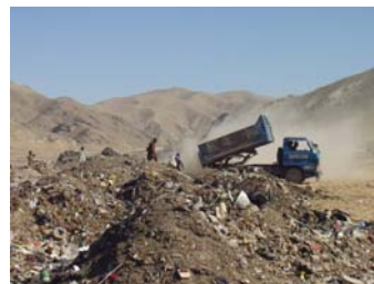
Abfallentsorgung in Herat.