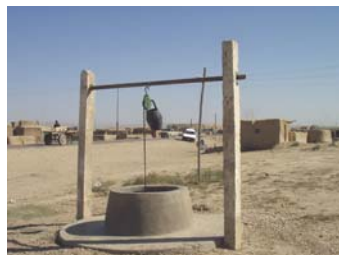
Brunnen in Mazar-e-Sharif.

In den Städten Kandahar, Kabul, Herat und Mazar-e-Sharif wurde die Belastung des Trinkwassers durch Bakterien mit dem mobilen Feldlabor des Schweizerischen Korps für Humanitäre Hilfe (SKH) vor Ort gemessen. Weiter wurden Proben zur Messung der Kontamination des Wassers durch Öl und Chemikalien erhoben, welche später im LABOR SPIEZ analysiert wurden.