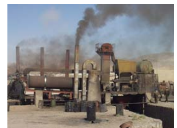
Luftverschmutzung durch Industrieanlagen, Teerfabrik in Herat.