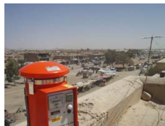
Messung der Staubbelastung der Luft in Mazar-e-Sharif.

Neben den Trinkwasseranalysen wurden auch Luftproben zur Messung der Staubbelastung erhoben. Weiter wurde die Situation der Abfall- und Abwasserentsorgung untersucht und Bodenproben in der Umgebung von Industrieanlagen erhoben.