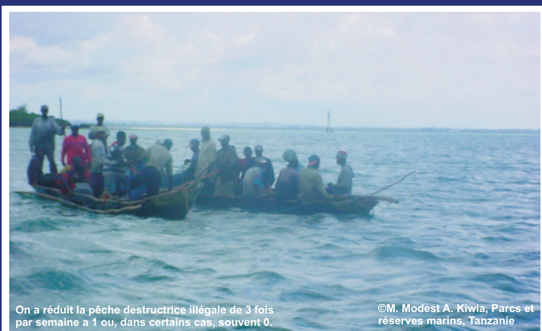
On a réduit la pêche destructrice illégale de 3 fois par semaine à 1 ou, dans certains cas, souvent 0.

Les bénéfices économiques des récifs sains Les récifs coralliens sains peuvent abaisser la faim et renverser le déclin de l'environnement. De plus, ils ont une valeur économique importante. En Indonésie, on estime que les récifs sains ont une valeur de $1,6 milliards de dollars par an. Si on rend compte des autres services telles que la tourisme, la commerce des espèces marines et la protection côtière, on constate l'immense valeur économique potentielle des récifs coralliens.