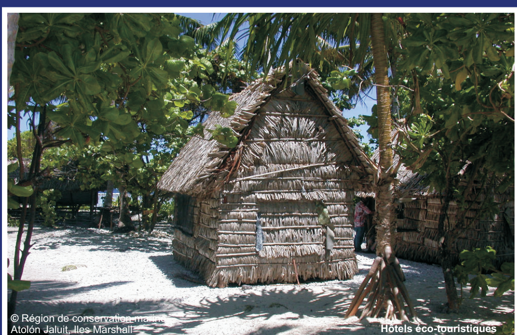
© Région de conservation Atoll, îles Marshall. Hôtels éco-touristiques

Dans la majorité des régions récifales du monde, la dégradation des environnements marins fait augmenter les niveaux de pauvreté. En outre le bilan humain, la perte ou la destruction des récifs entraînent: la perte des habitats, la perte du sable et, par la suite, les plages qui sont essentielles au tourisme et aussi la perte de protection côtière contre les vagues.