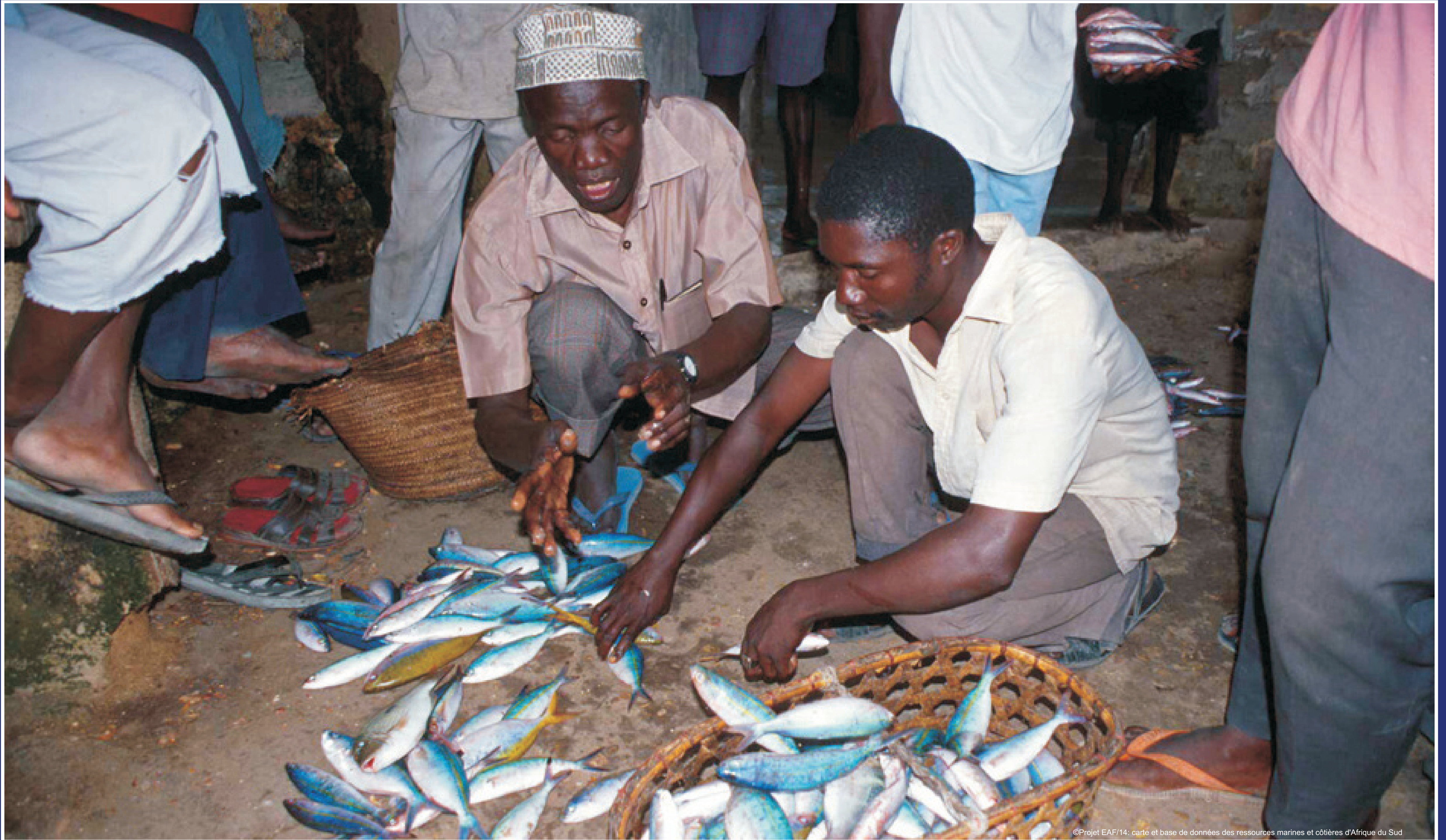
©Projet EAF/14: carte et base de données des ressources marines et côtières d'Afrique du Sud