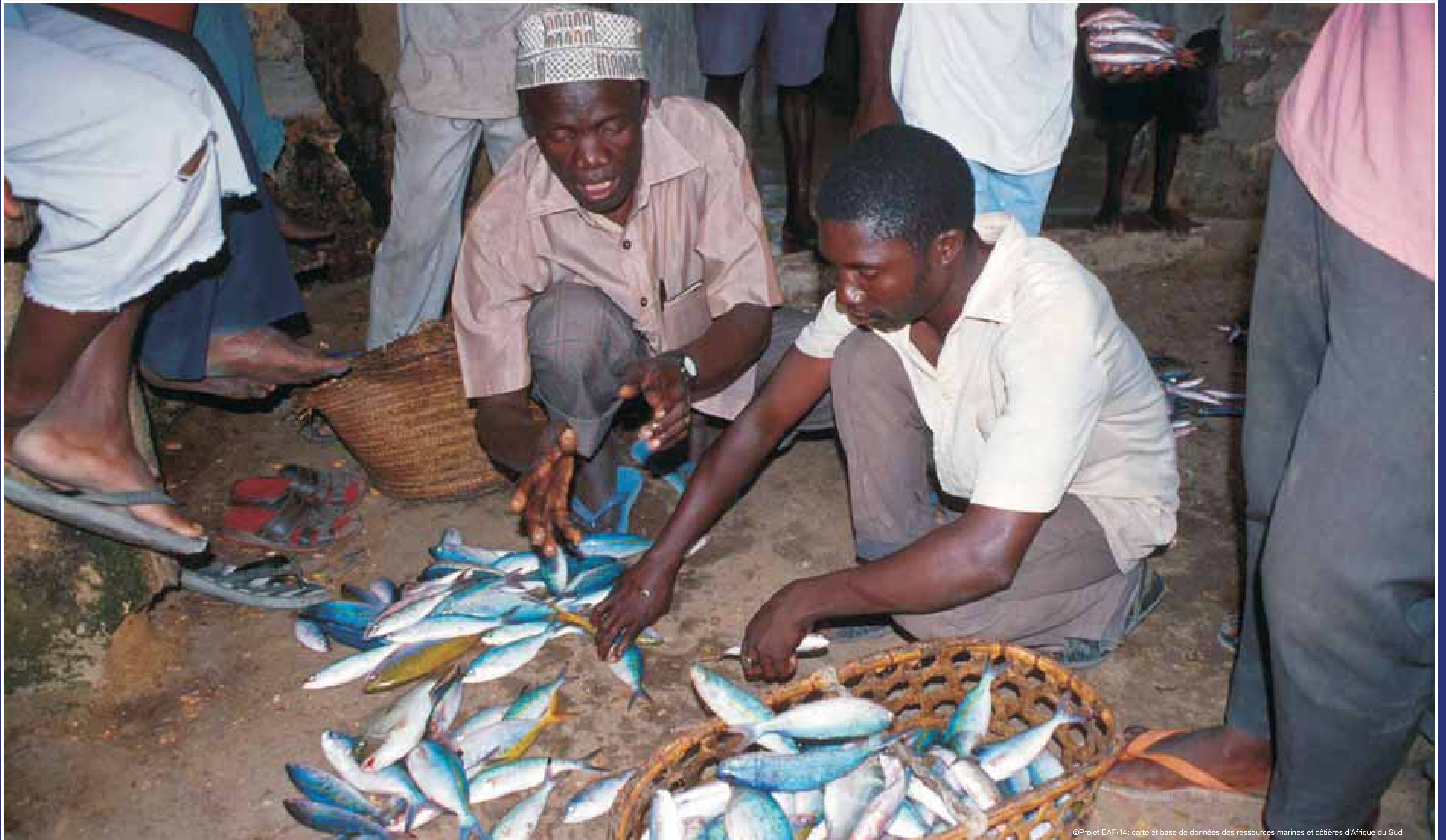
©Projet EAF/14; carte et base de données des ressources marines et côtières d'Afrique du Sud