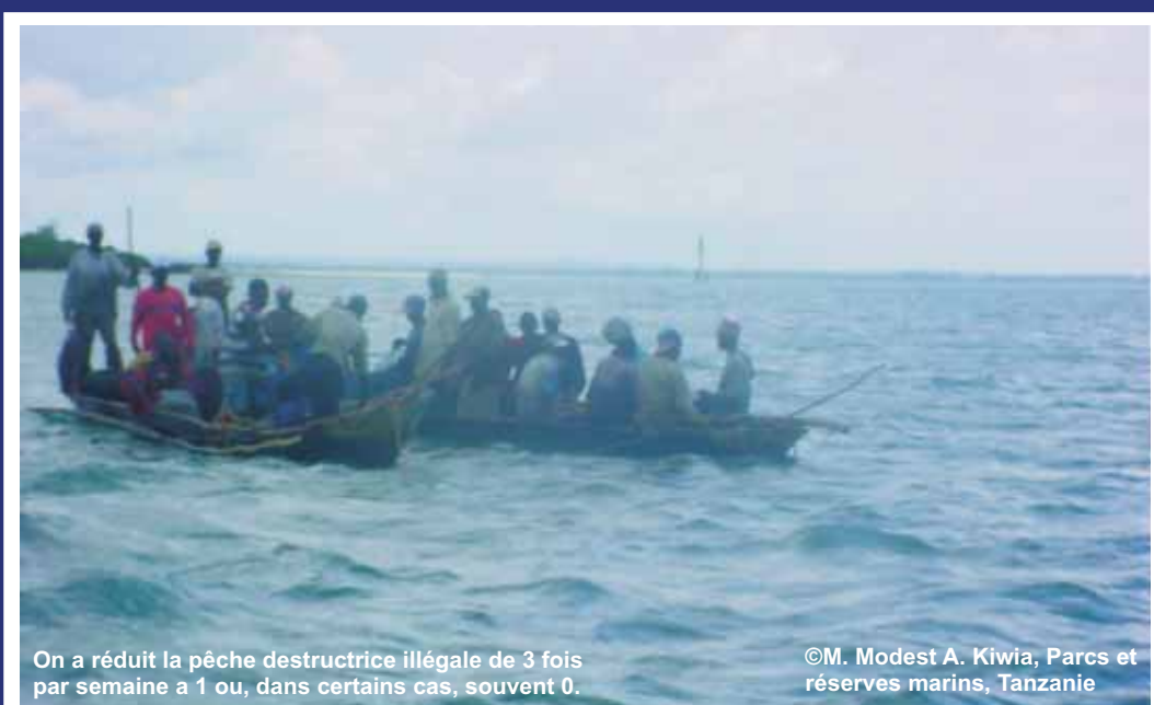
On a réduit la pêche destructrice illégale de 3 fois par semaine à 1 ou, dans certains cas, souvent 0.

En Indonésie, on estime que la sur-pêche et la pêche destructrice vont mener aux pertes de plus de $1,3 milliards de dollars au cours des 20 ans à venir. Les communautés, sans la capacité de survivre à travers la pêche, seraient obligés de produire ou d'importer des autres types de nourriture, ce qui augmente le taux de chômage encore plus.