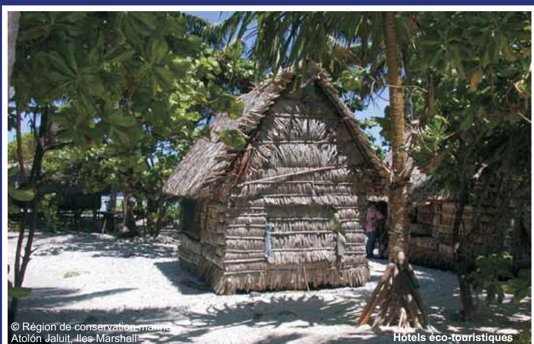
© Région de conservation marine Atoll, îles Marshall. Hôtels éco-touristiques

Dans la majorité des régions récifales du monde, la dégradation des environnements marins fait augmenter les niveaux de pauvreté. En outre le bilan humain, la perte ou la destruction des récifs entraînent: la perte des habitats, la perte du sable et, par la suite, les plages qui sont essentielles au tourisme et aussi la perte de protection côtière contre les vagues.