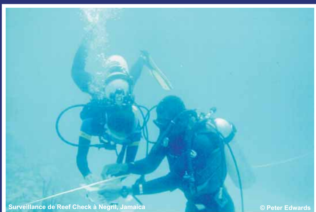
Surveillance de Reef Check à Negril, Jamaïque

Les partenaires d'ICRAN travaille à fournir cartes détaillées des récifs coralliens et à consolider les renseignements qui adressent les besoins des gestionnaires des espaces marins protégés et des communautés côtières.