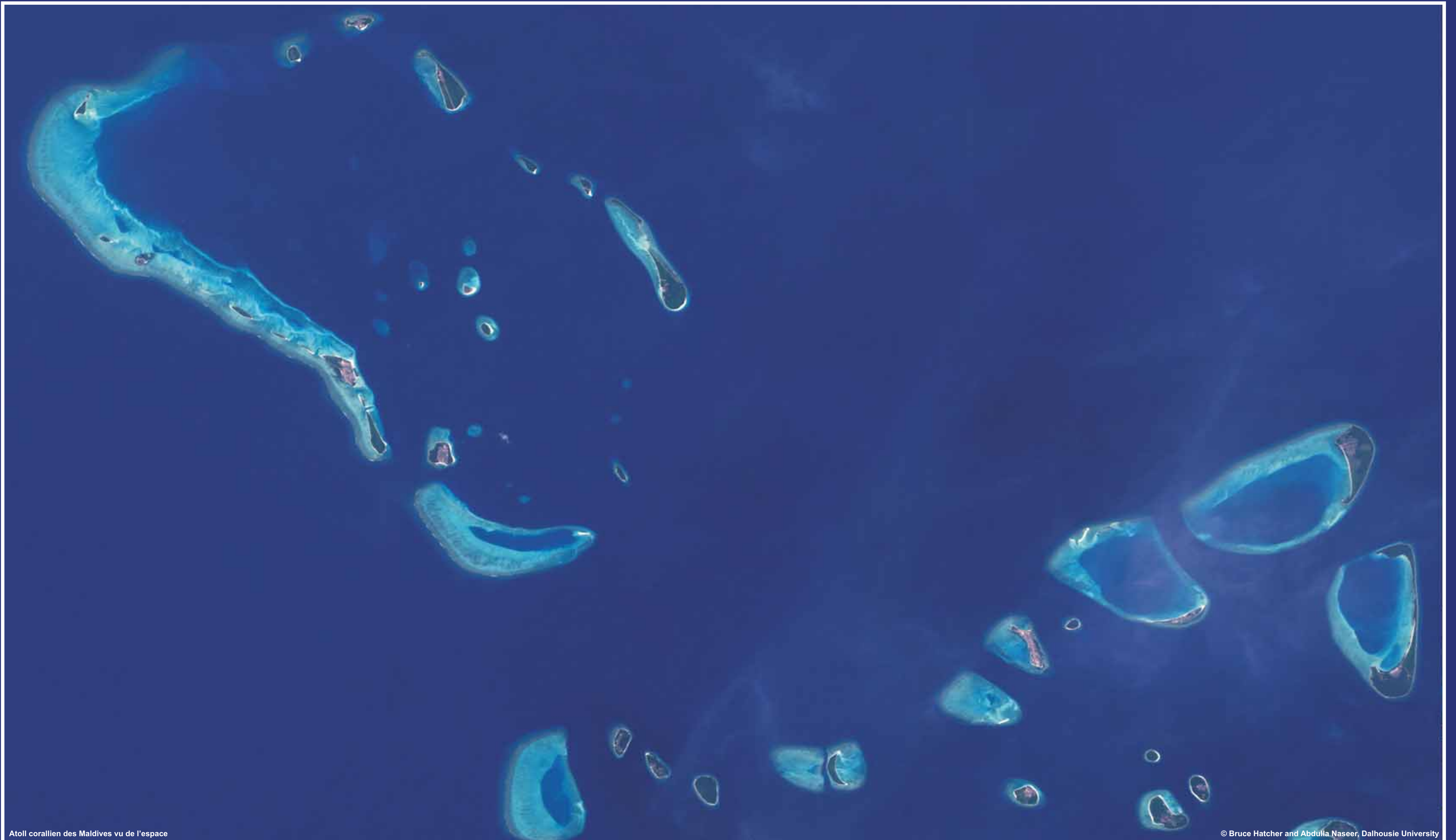
Atoll corallien des Maldives vu de l'espace