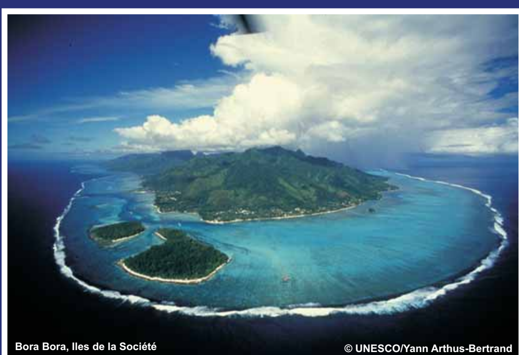
Bora Bora, Iles de la Société

La démarche stratégique d'ICRAN envers la gestion, évaluation et éducation dans le milieu récifale a été développée d'assurer la future de ces écosystèmes précieux, et la future des communautés qui en dépendent.