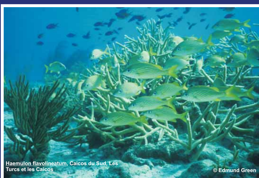
Haemulon flavolineatum, Calicos du Sud, Les Turcs et les Caicos

Comme les autres écosystèmes tropicaux, telles que les mangliers et les herbiers, les récifs coralliens protègent nos plages, côtes et biens côtiers.