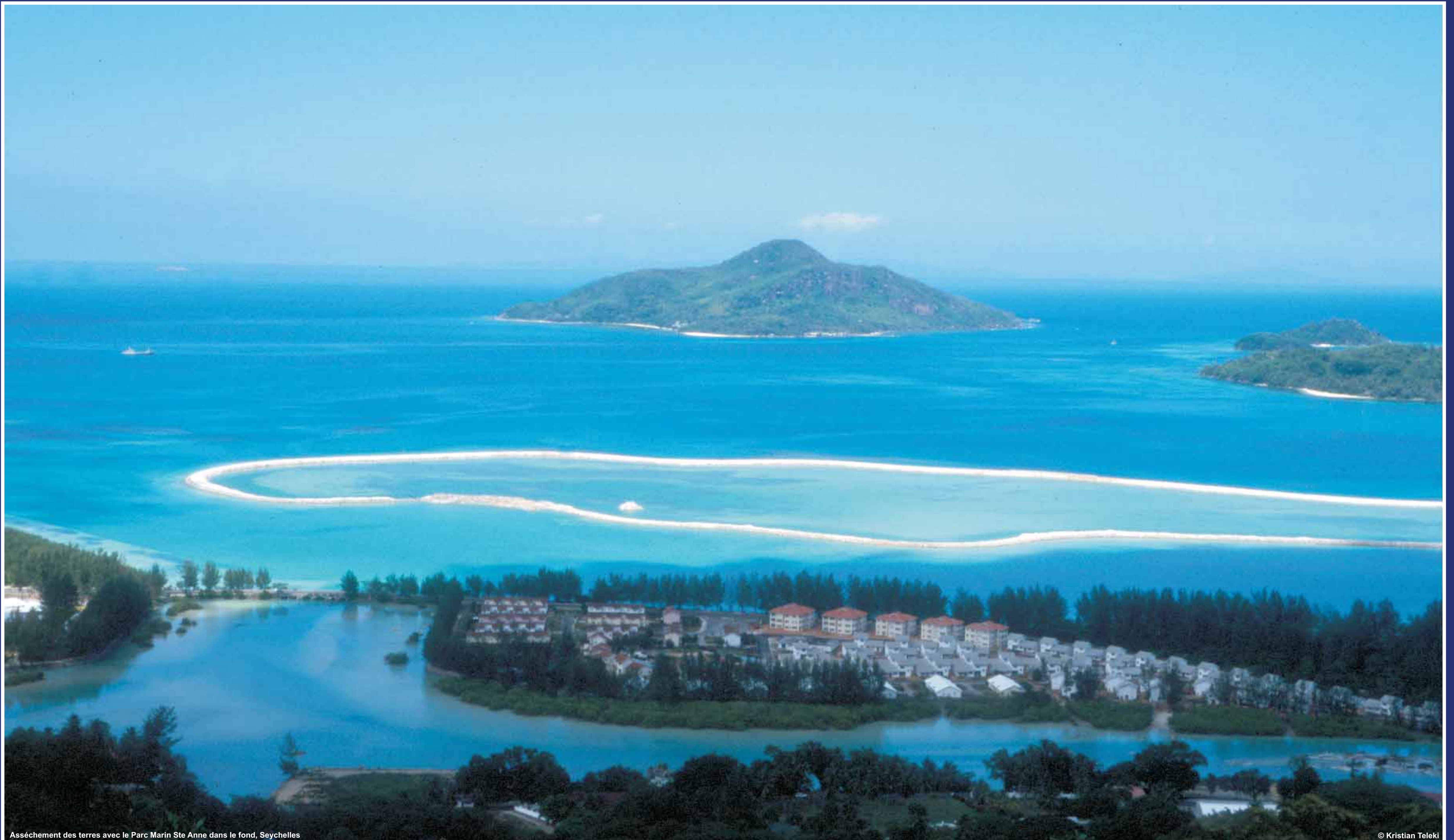
Assèchement des terres avec le Parc Marin Ste Anne dans le fond, Seychelles