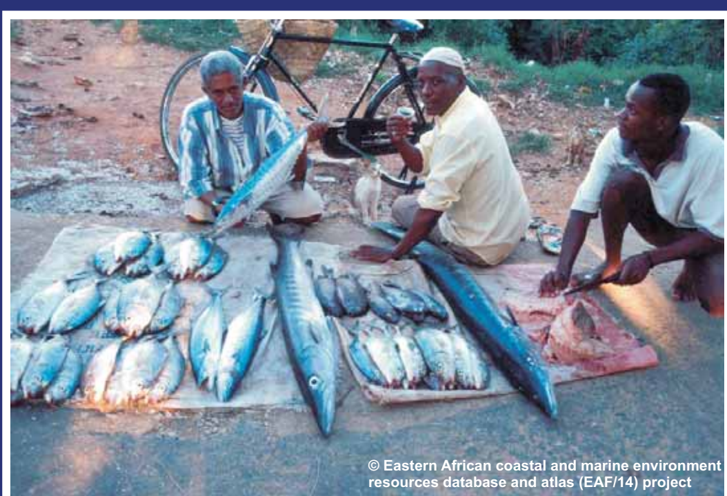
On protège les récifs coralliens pour les communautés qui en dépendent