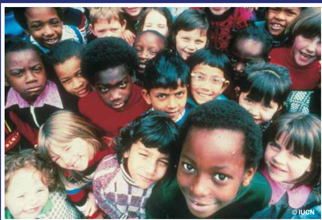
Récifs coralliens pour nos enfants

icran@icran.org www.icran.org www.coralreeffund.org