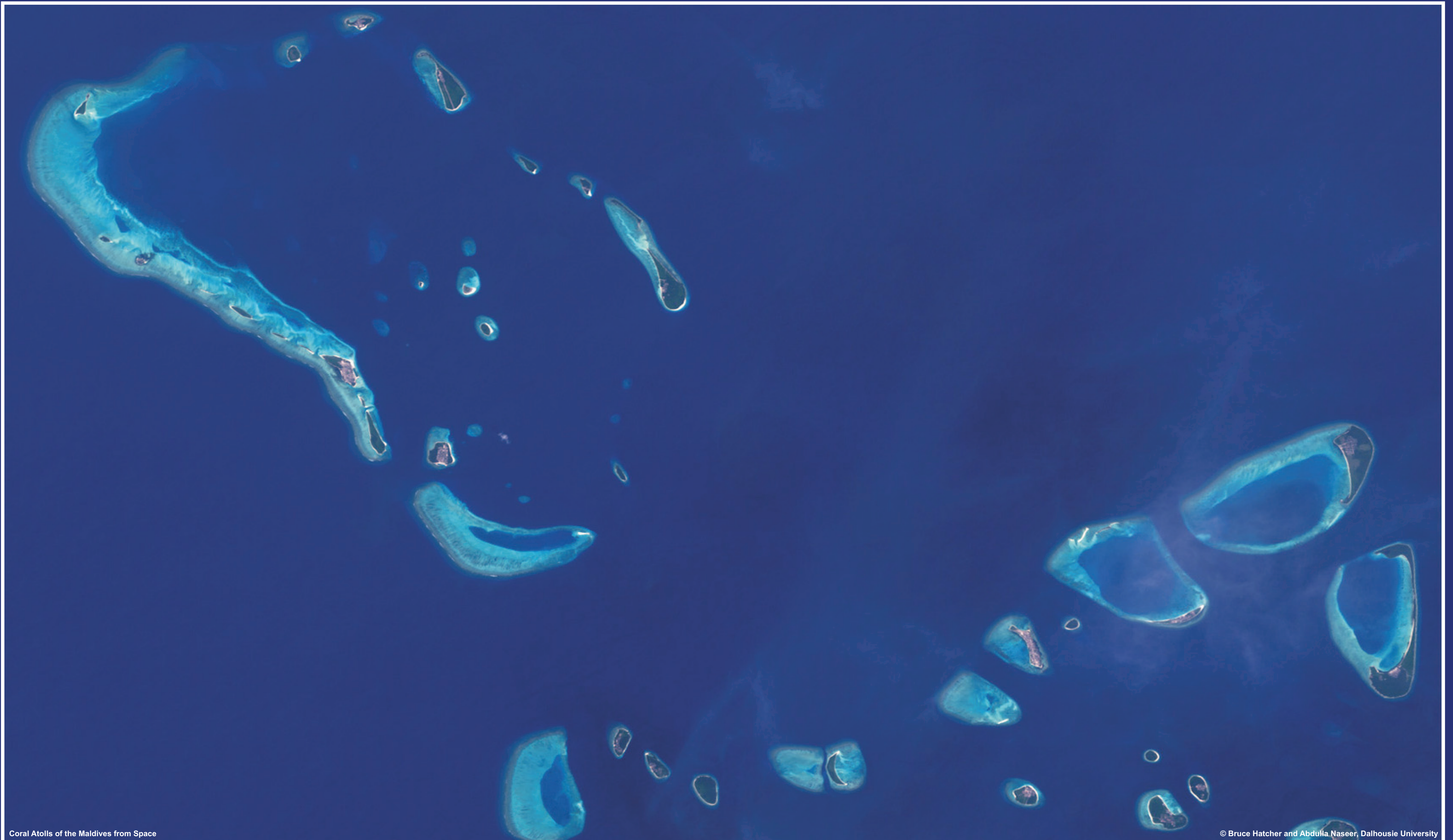
Coral Atolls of the Maldives from Space