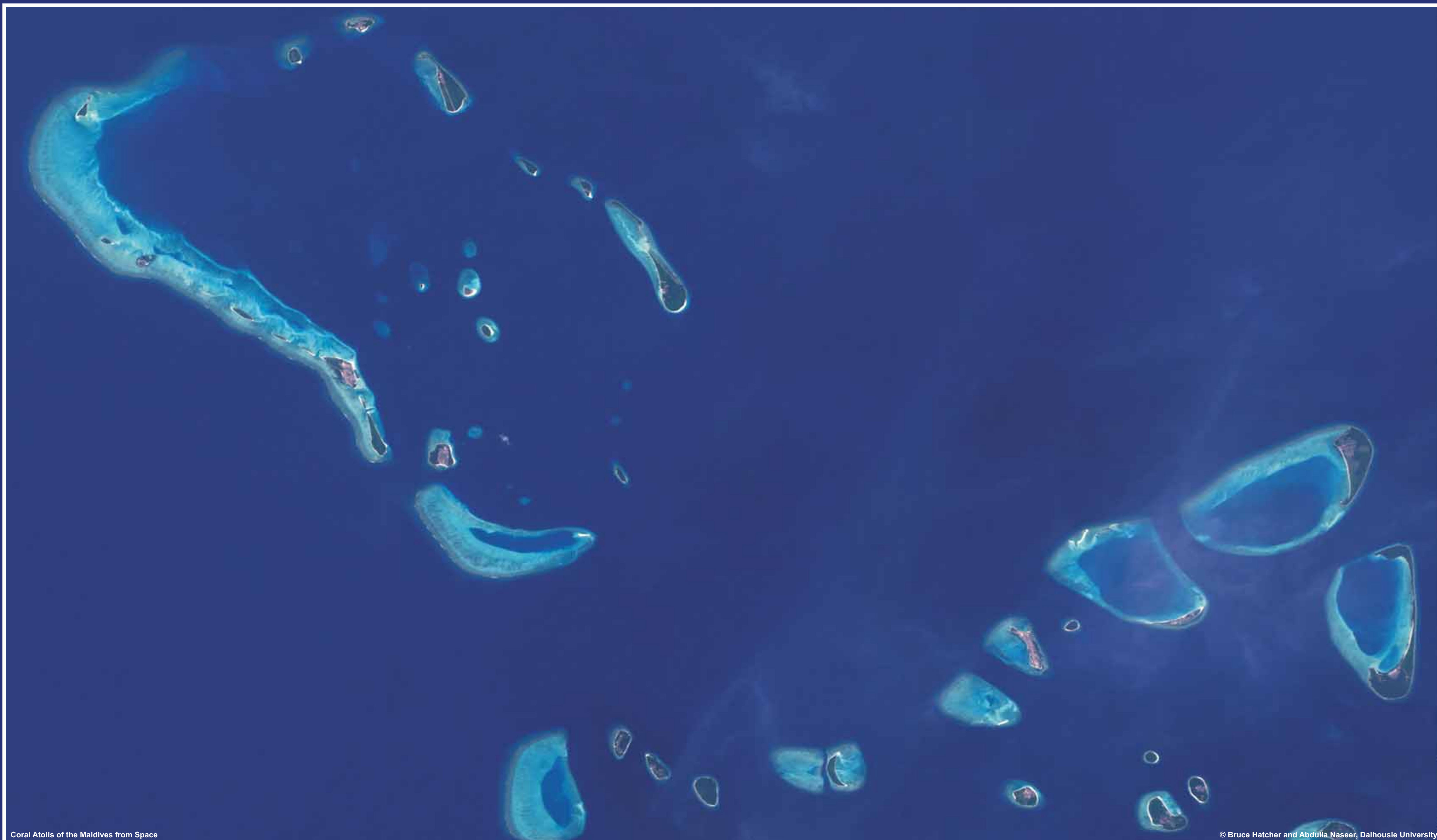
Coral Atolls of the Maldives from Space