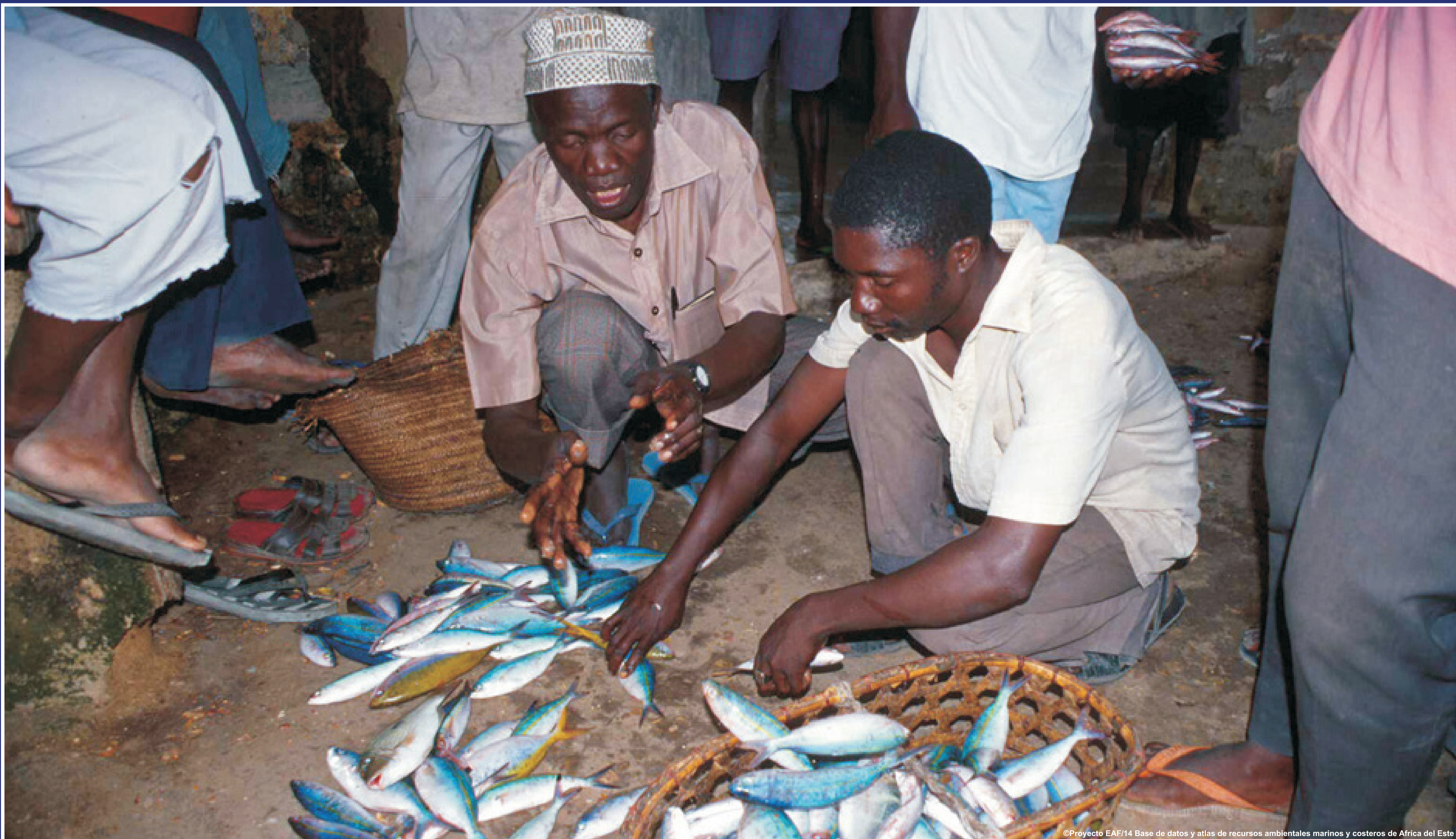
©Proyecto EAF/14 Base de datos y atlas de recursos ambientales marinos y costeros de África del Este