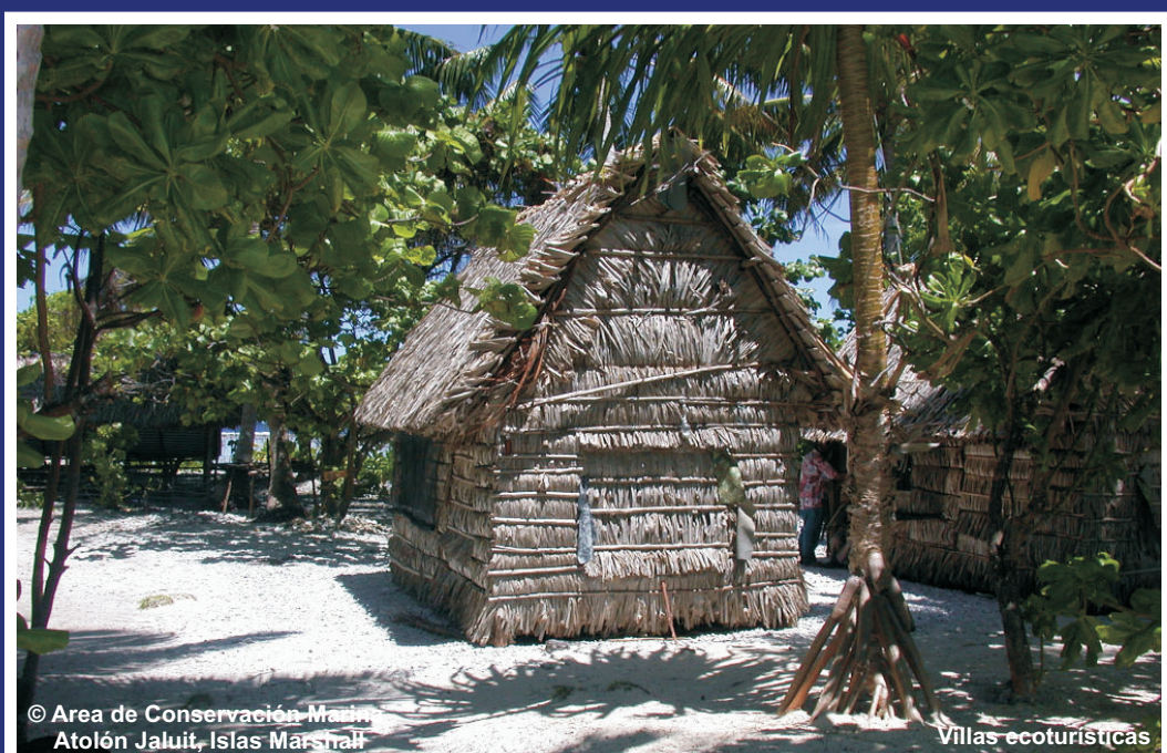
Villares ecoturísticas

Alrededor del mundo el daño al medio marino aumenta los niveles de pobreza de forma alarmante. La destrucción de arrecifes conlleva a la pérdida de hábitat, la provisión natural de arena a las playas y a la pérdida de rompeolas naturales que protejan a las zonas costeras de las olas de las tormentas.