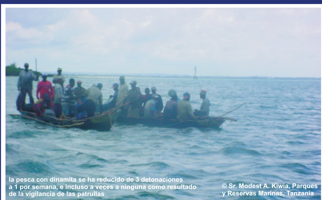
La pesca con dinamita se ha reducido de 3 detonaciones a 1 por semana, e incluso a veces a ninguna como resultado de la vigilancia de las patrullas.

icran@icran.org www.icran.org www.coralreeffund.org