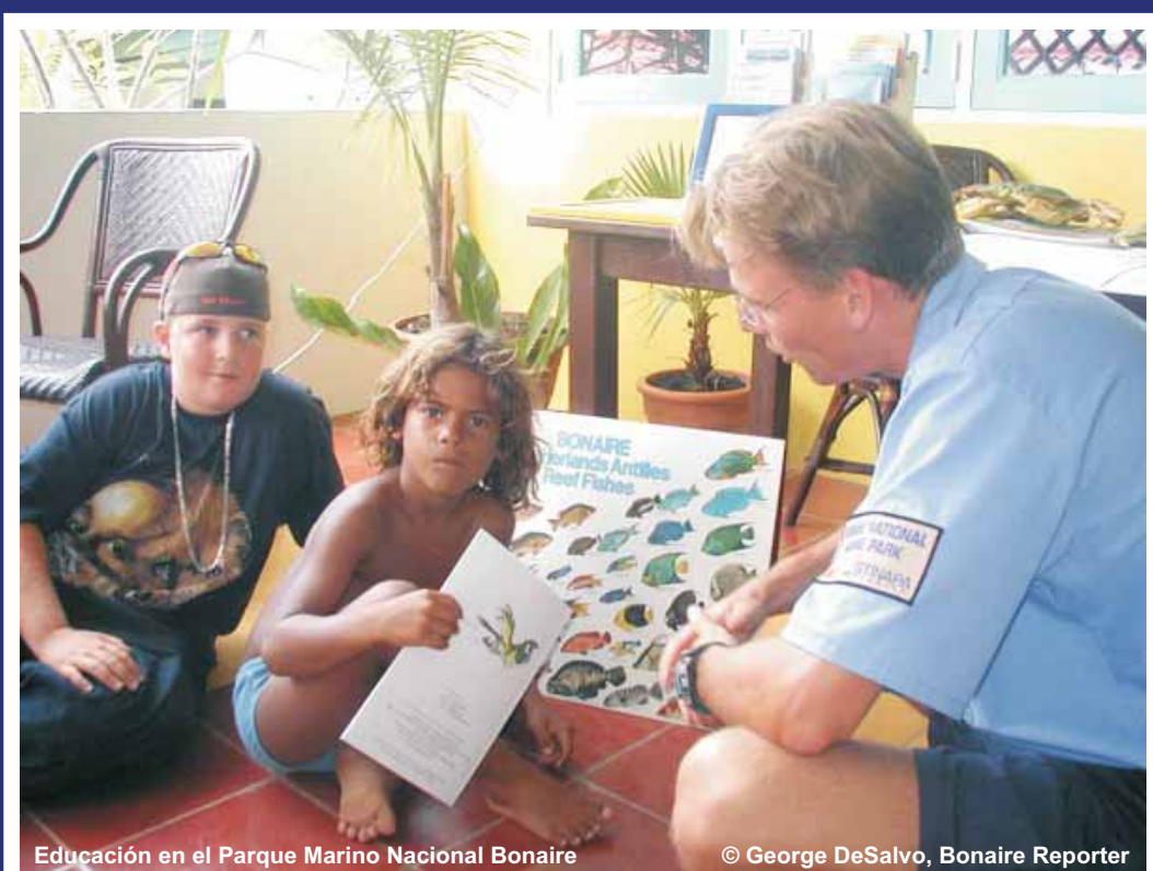
Educación en el Parque Marino Nacional Bonaire

Los eventos comunitarios locales ayudan a educar comunidades sobre los beneficios de los arrecifes sostenibles y hacen divertido el proceso de concientización sobre el ambiente marino.