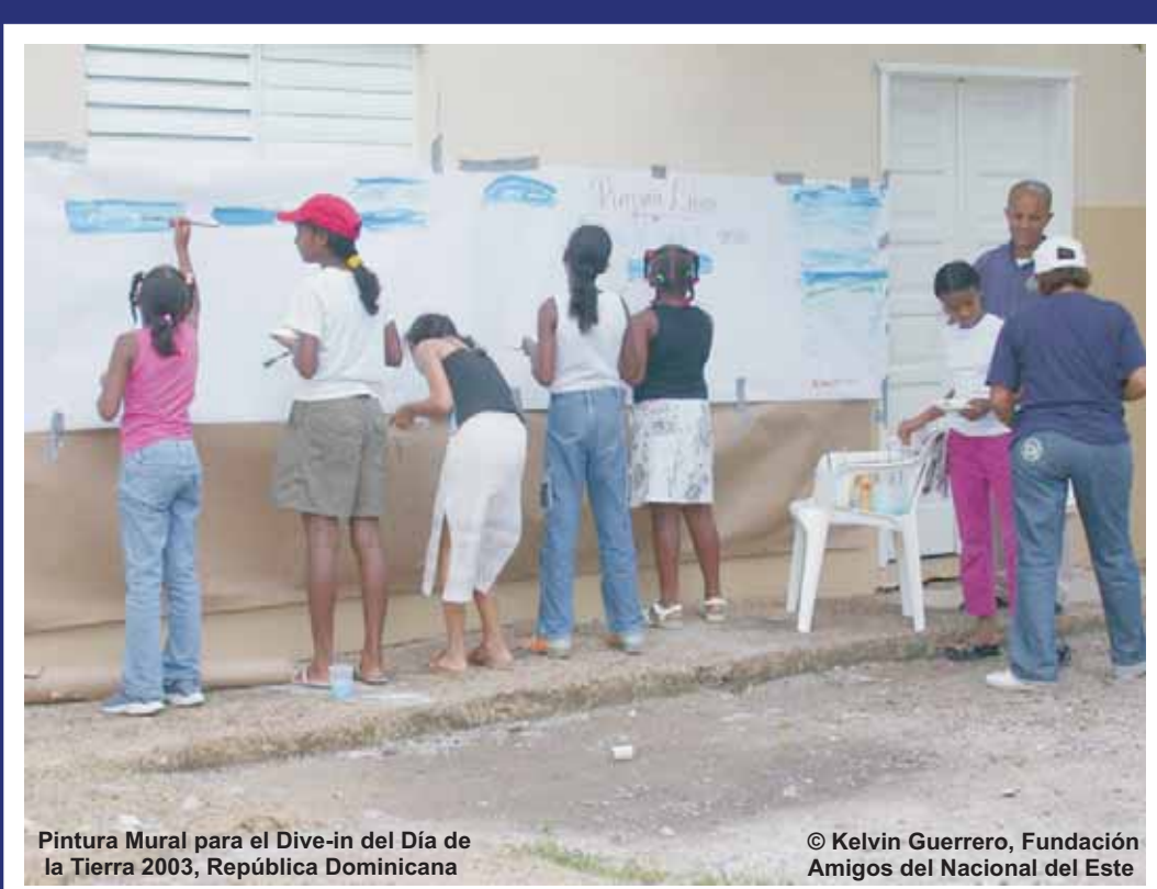
Pintura Mural para el Dive-in del Día de la Tierra 2003, República Dominicana © Kelvin Guerrero, Fundación Amigos del Nacional del Este