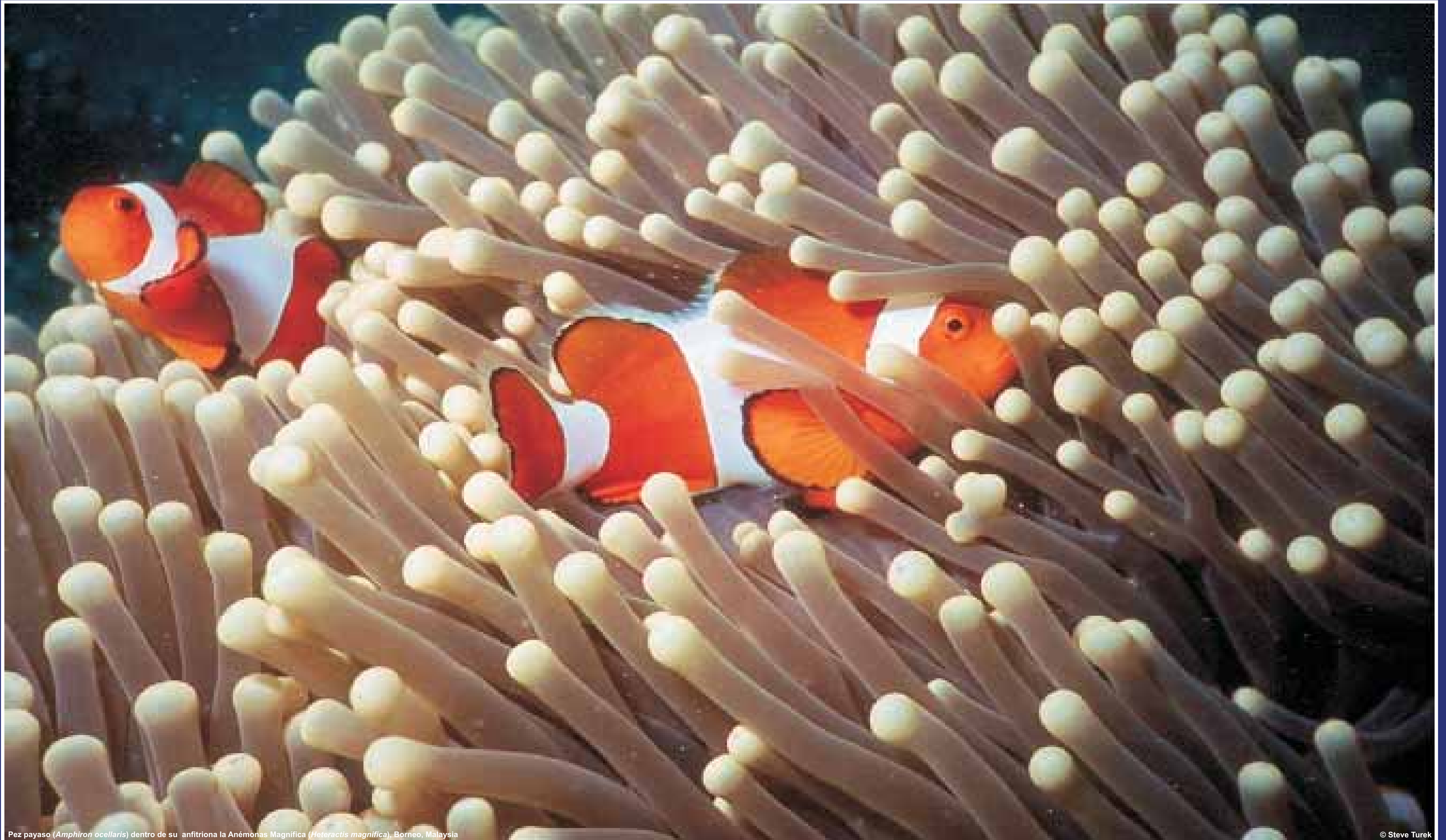
Pez payaso ( Amphiprion ocellaris ) dentro de su anfitriona la Anémone Magnífica ( Heteractis magnifica ). Borneo, Malasia