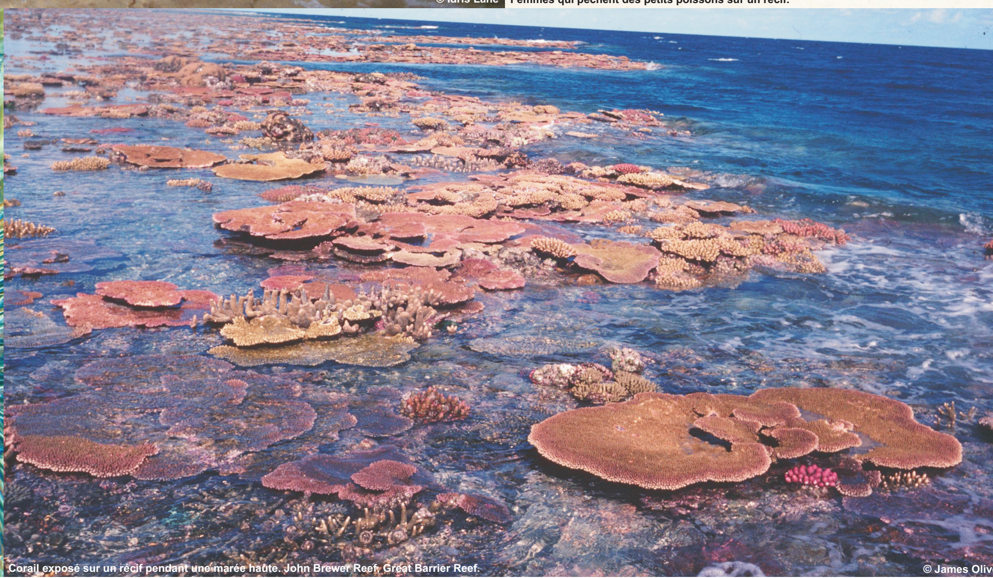
Corail exposé sur un récif pendant une marée haute, John Brewer Reef, Great Barrier Reef.