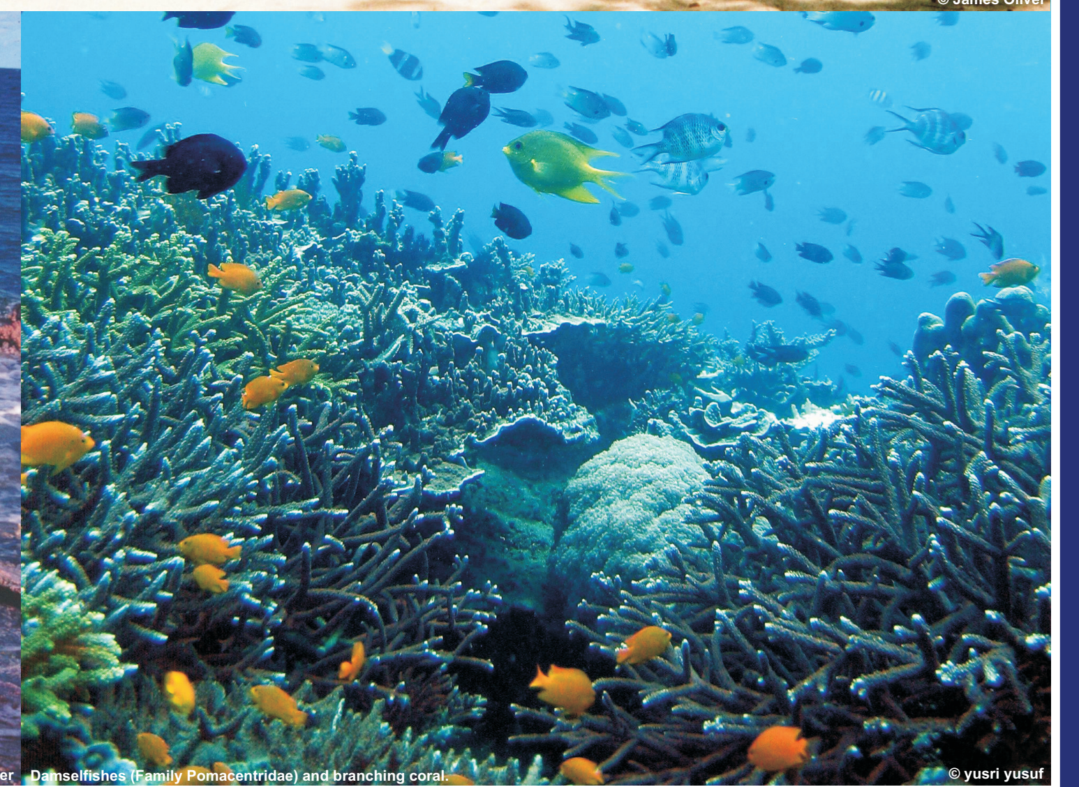
Danselles (Family Pomacentridae) and branching coral.