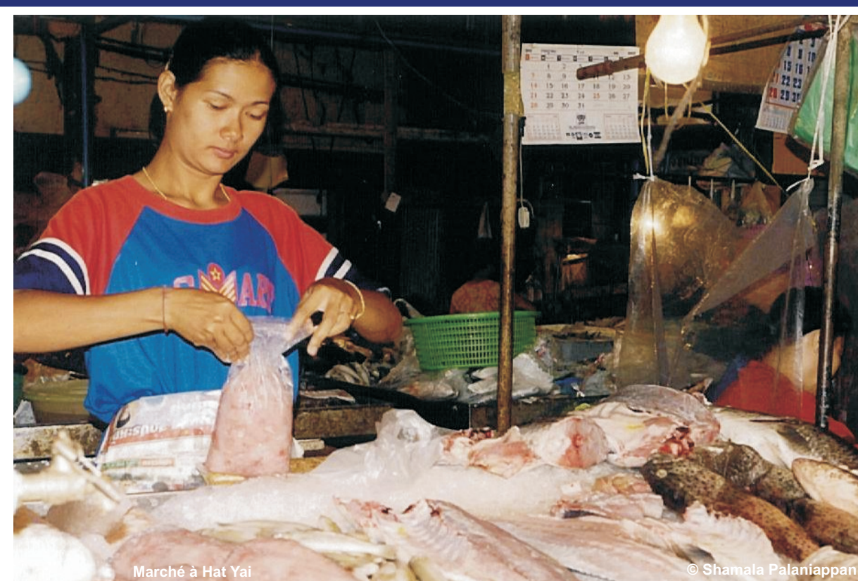
Tendre vers un tourisme durable