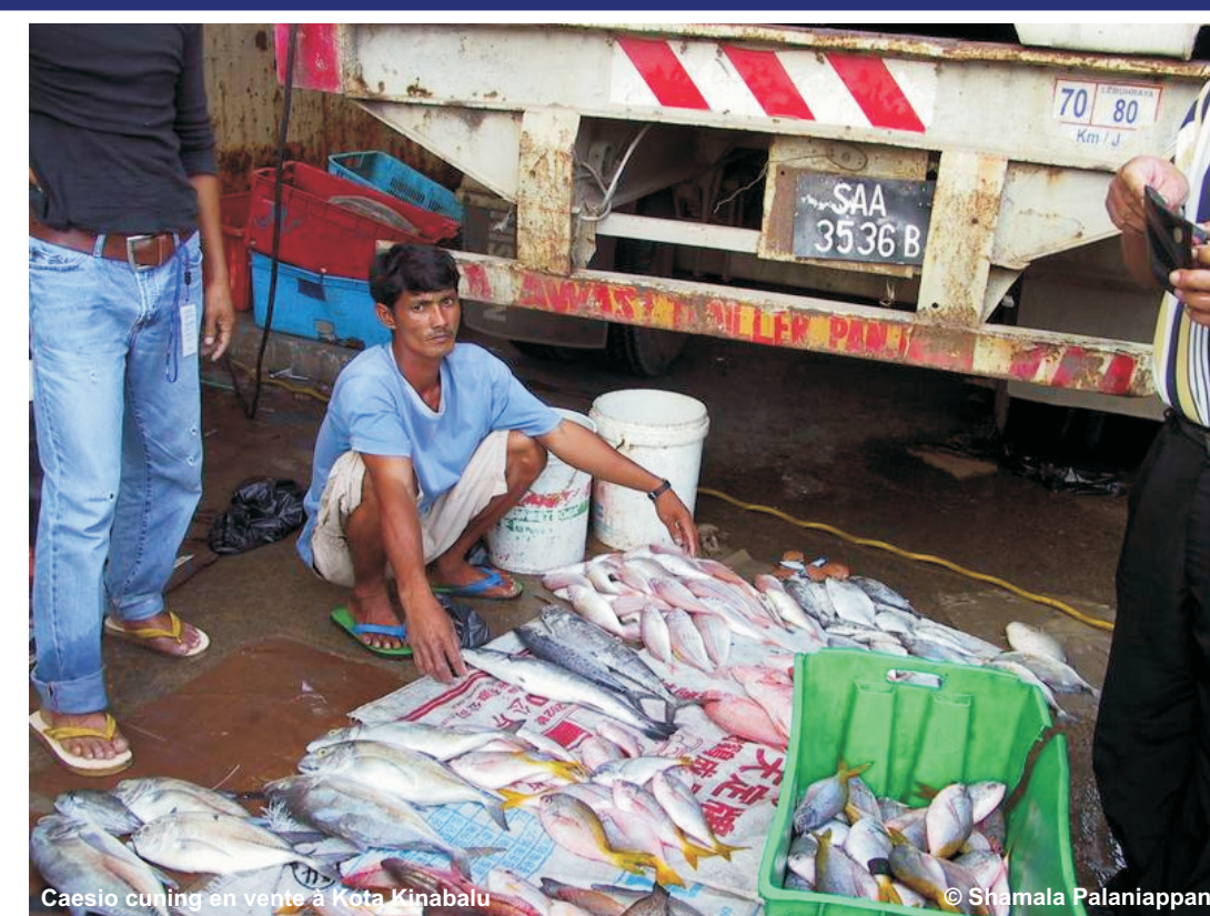
Les récifs sains sont nécessaires pour obtenir des moyens d'existence durables

Aujourd'hui, ICRI continue de fournir un point de convergence pour les problèmes liés aux récifs de corail et réunit un large spectre de partenaires tels que des gouvernements, des organisations des Nations Unies, des banques de développement multilatérales, des ONG dans le domaine de l'environnement et du développement et le secteur privé. En plus des problèmes naissants, ICRI va se concentrer à l'avenir sur les liens entre la santé des récifs de corail et le bien-être des personnes qui en dépendent, en cherchant des moyens pour parvenir à une utilisation durable et équitable des ressources des récifs de corail.