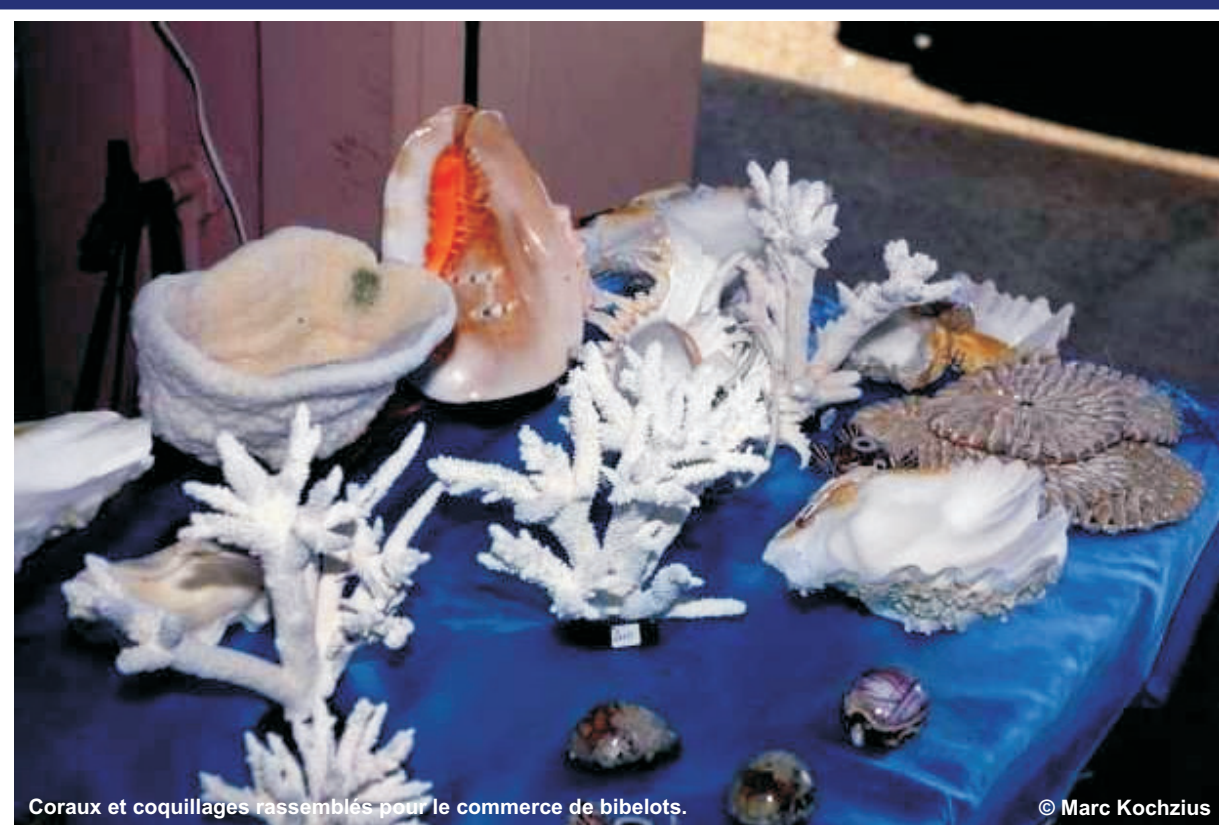
Corail en vente aux touristes