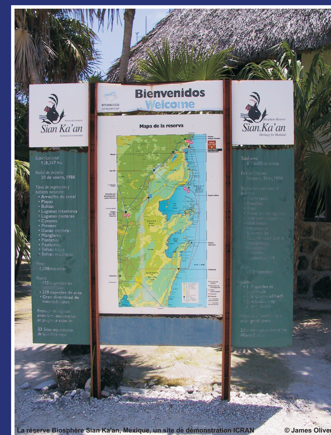
ICRAN cherche des moyens innovateurs pour gérer les écosystèmes des récifs de corail de manière à répondre aux besoins des gens qui en dépendent. ICRAN assiste les communautés locales pour qu'elles continuent de construire sur des techniques de gestion efficaces en partageant les expériences et les leçons apprises auprès d'autres communautés.