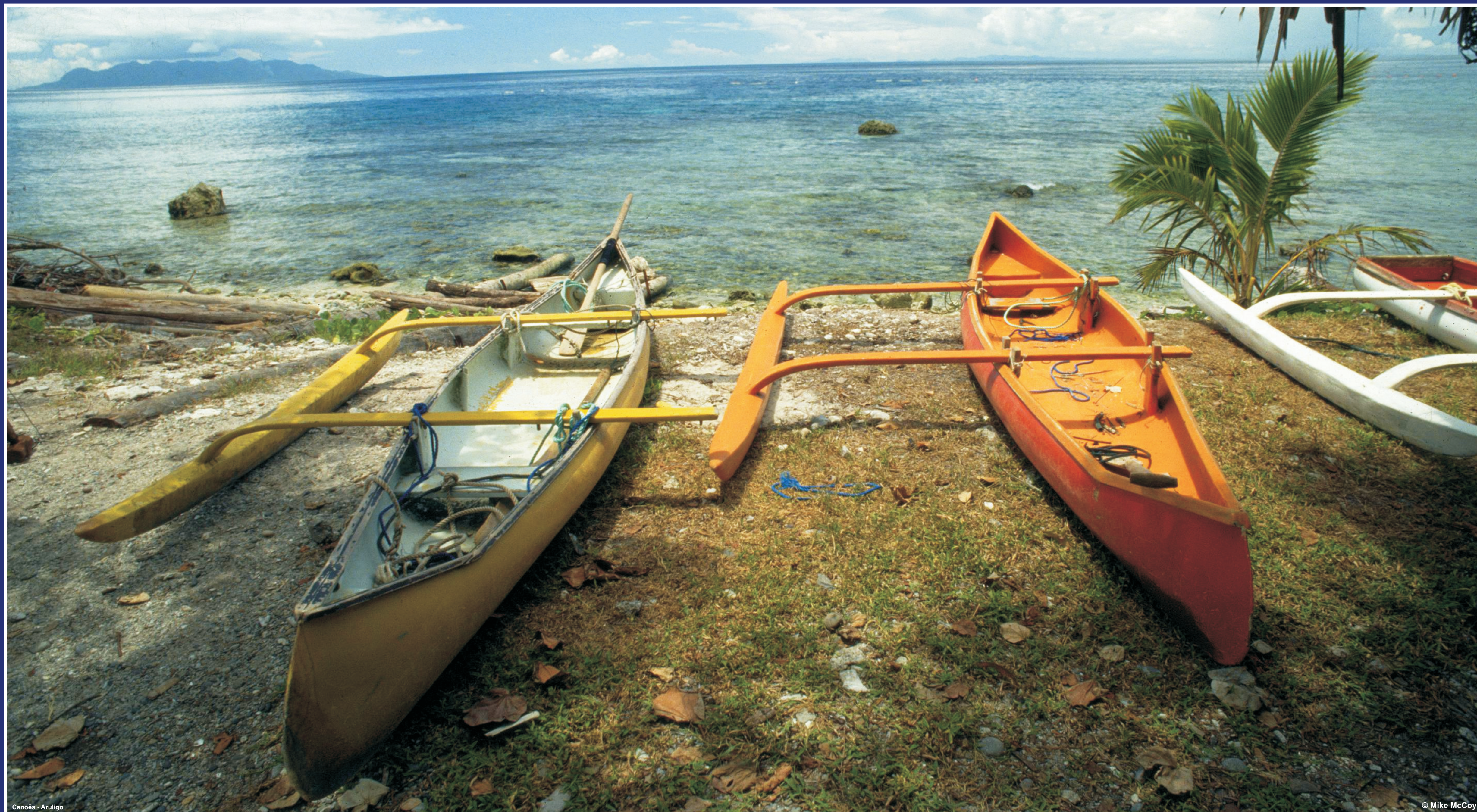
Canots - Aruligo