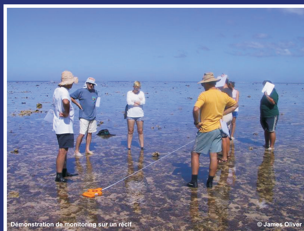
Démonstration de monitoring sur un récif.