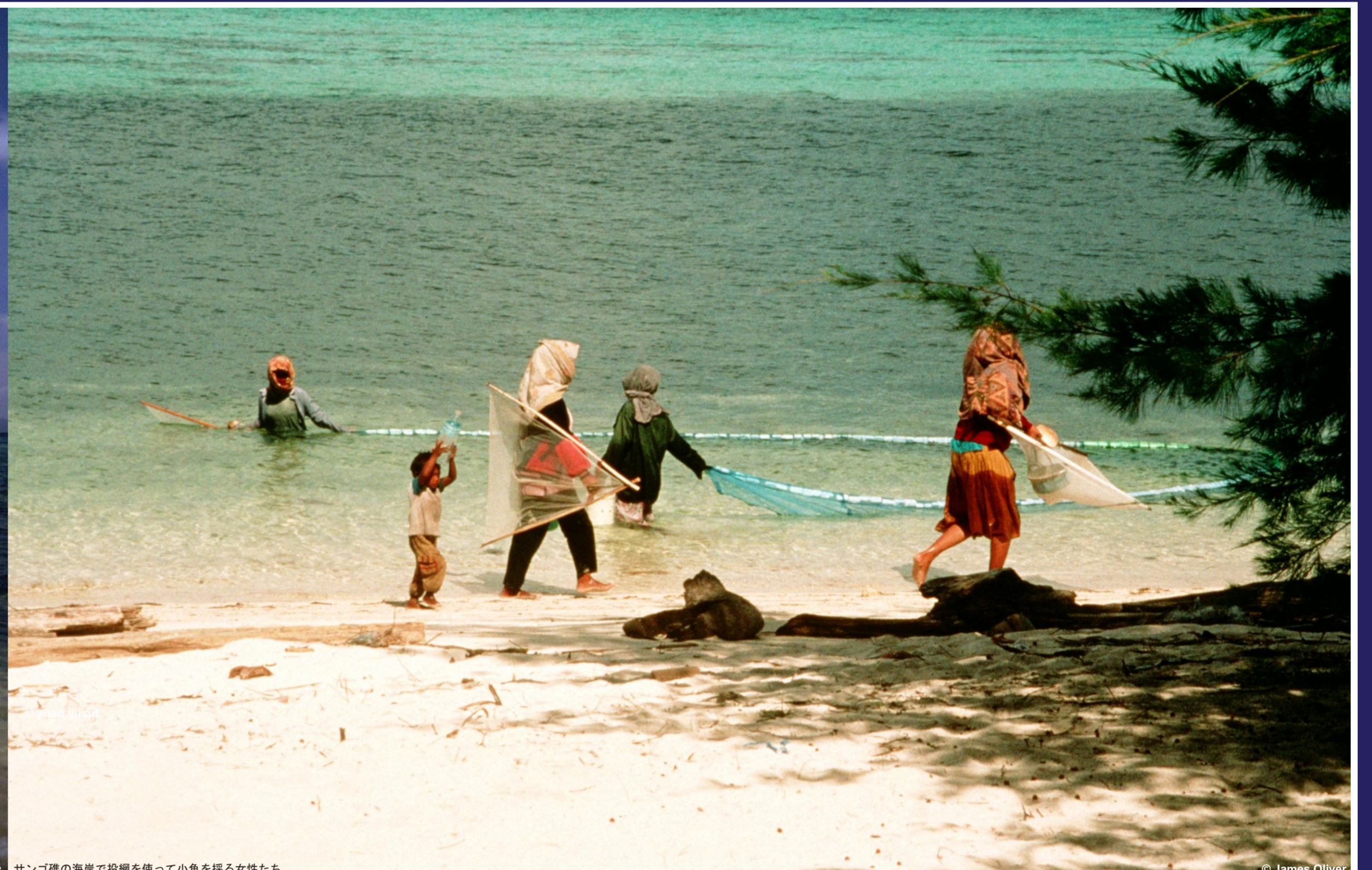
サンゴ礁の海岸で投網を使って小魚を採る女性たち