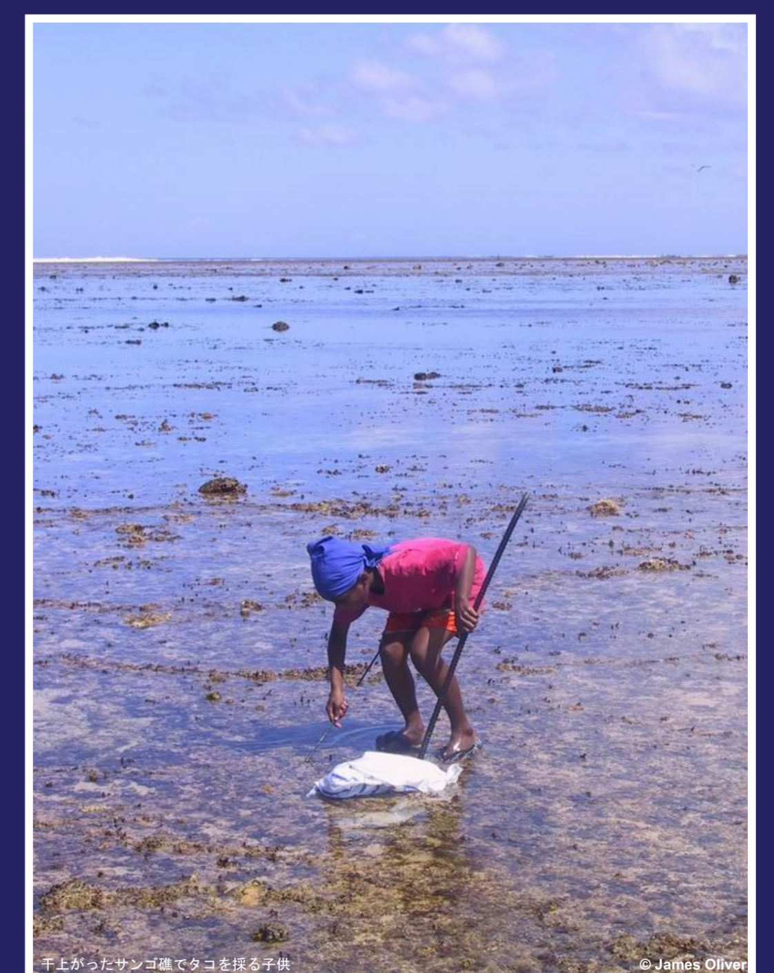
干上がったサンゴ礁でタニを採る干渉

国際サンゴ礁イニシアティブ (ICRI) は、サンゴ礁に関する途上国のニーズを国際協力の実施機関や資金提供機関に対して伝える役割を果たしています。