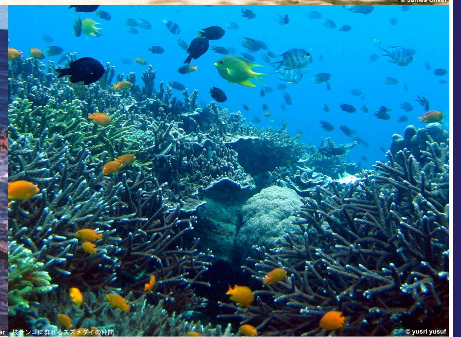
サンゴに群がるスズメダイの群