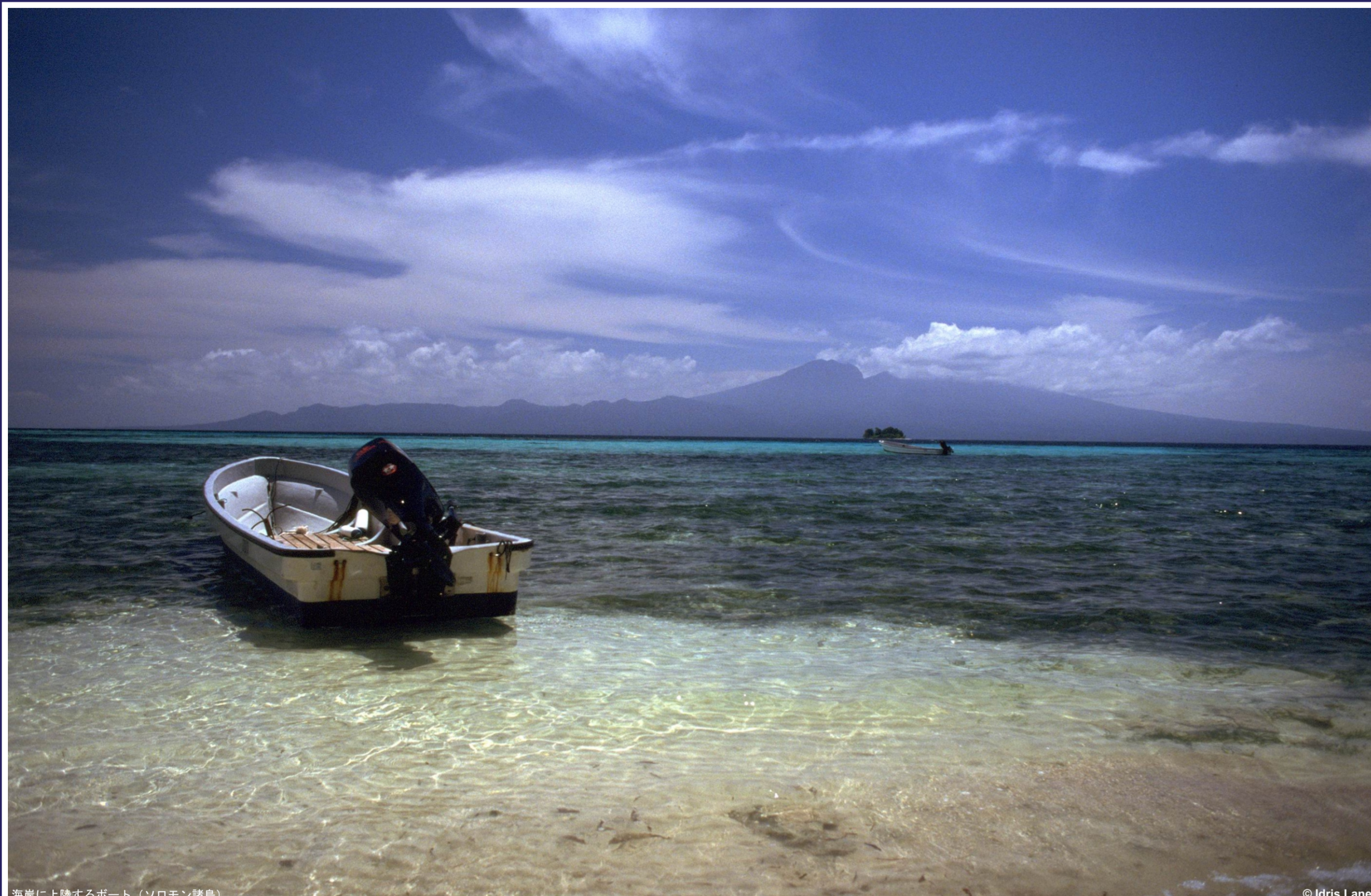
海岸に上陸するボート (ソロモン群島)