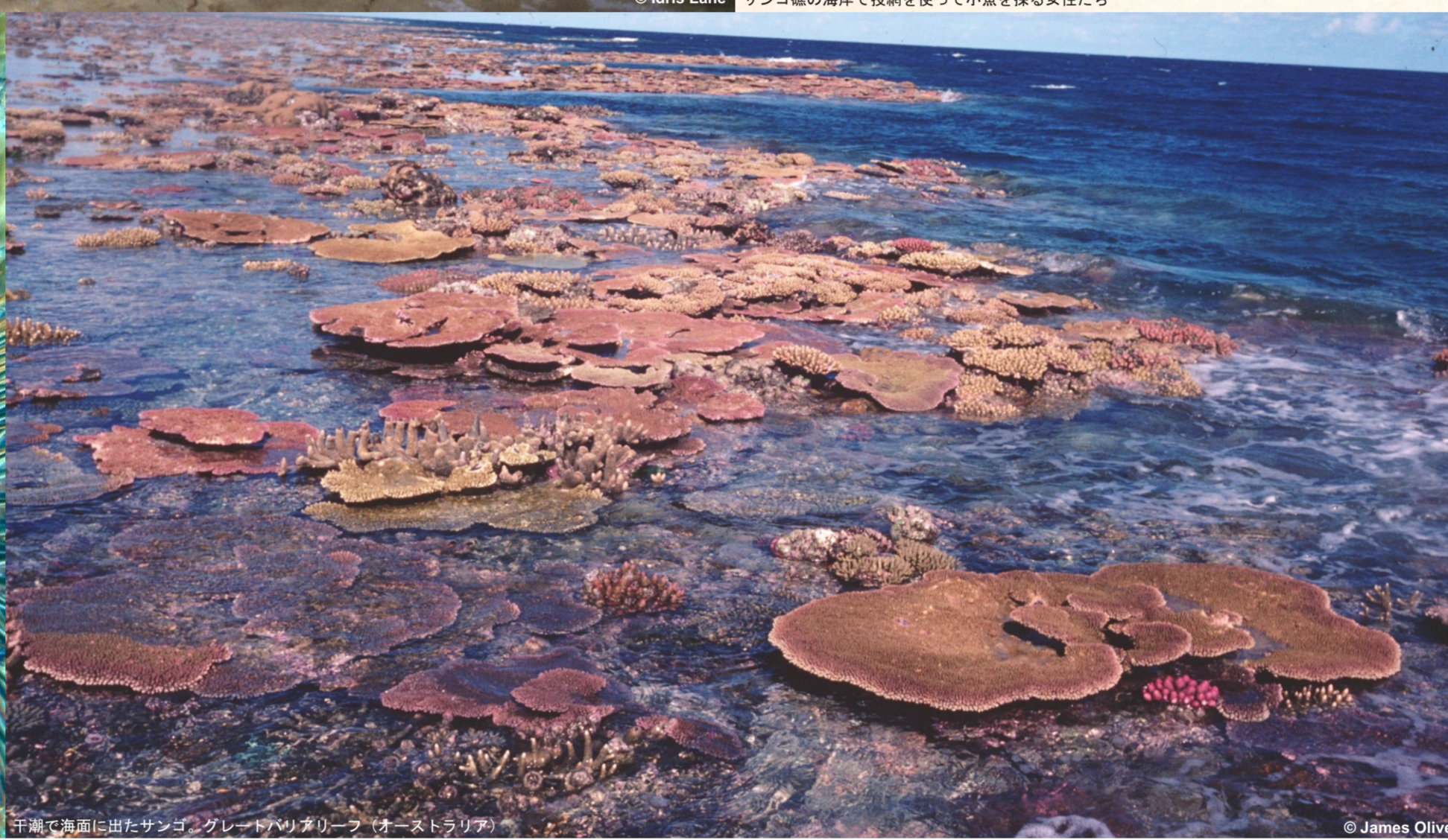
干潮で海面に出たサンゴ (グレートバリアリーフ (オーストラリア))