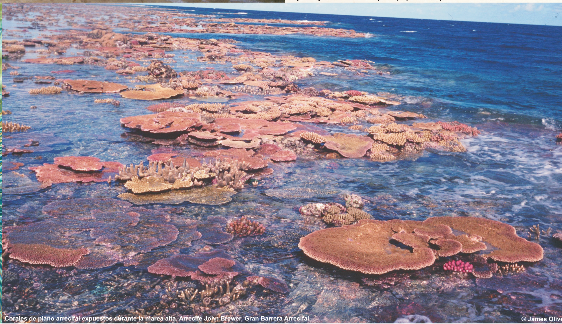
Corales de plano arrecifal expuestos durante la marea alta. Arrecife John Sleywer, Gran Barrera Arrecifal.