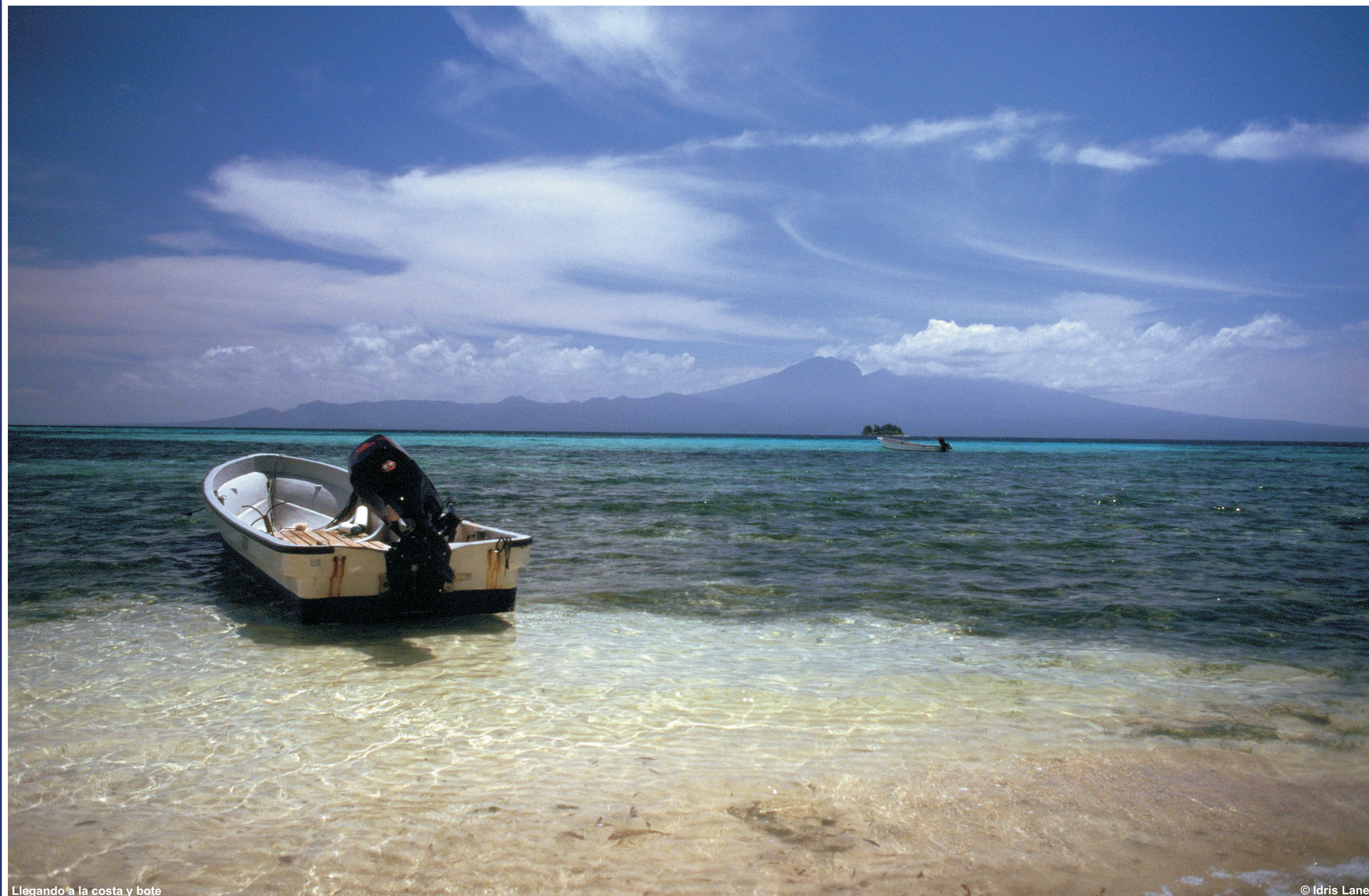
Llegando a la costa y bote