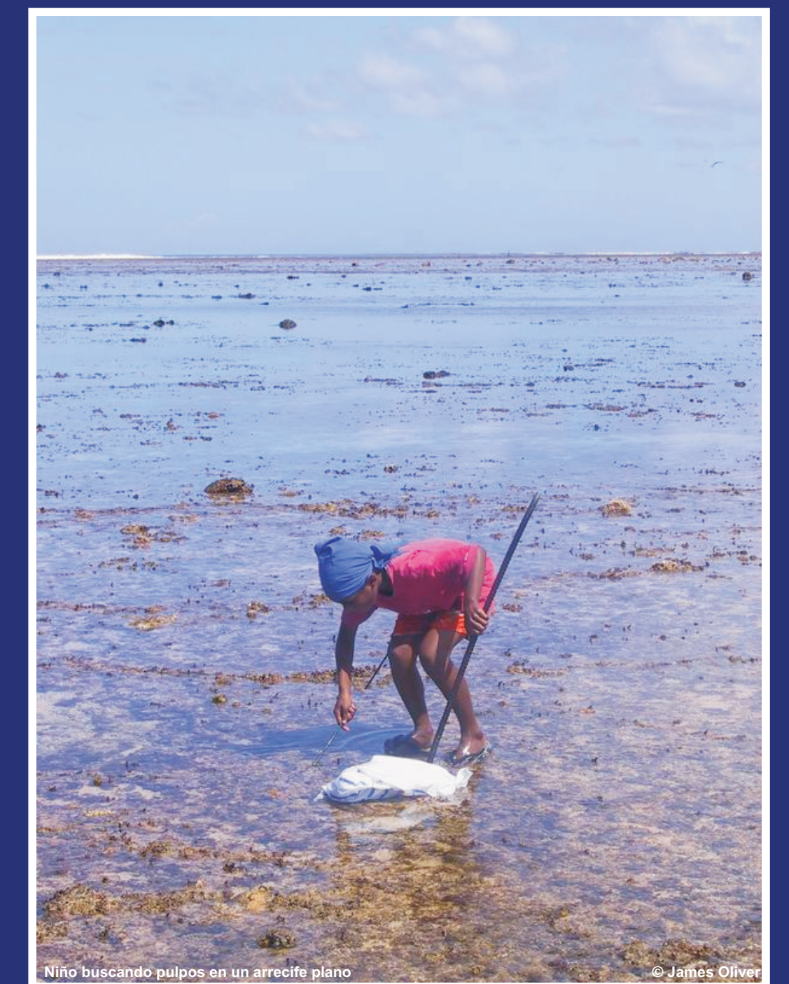
Niño buscando pulpos en un arrecife plano.

ICRI asegura que las necesidades del mundo en desarrollo relacionadas con sus corales sean transmitidas a organizaciones operacionales y donantes.