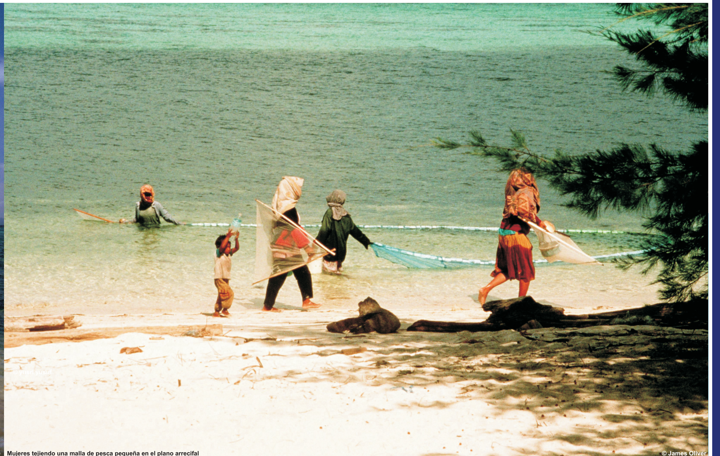
Mujeres tejendo una malla de pesca pequeña en el plano arrecifal