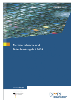
Datenbankangebot 2009 - Die Broschüre informiert umfassend über die Recherchemöglichkeiten beim DIMDI: Zu bestellen im DIMDI Webshop.

Beim DIMDI sind Volltexte aus über 1.400 medizinischen Zeitschriften online in Verlagsdatenbanken abrufbar. Darüber hinaus verlinken die Rechercheergebnisse zu Volltexten bei anderen Online-Anbietern. Ihre Verfügbarkeit wird dazu bei der Elektronischen Zeitschriftenbibliothek EZB bzw. über lokale Link-Resolver abgefragt. Nach entsprechender Registrierung können dabei Ihre eigenen Zeitschriftenlizenzen berücksichtigt werden. »