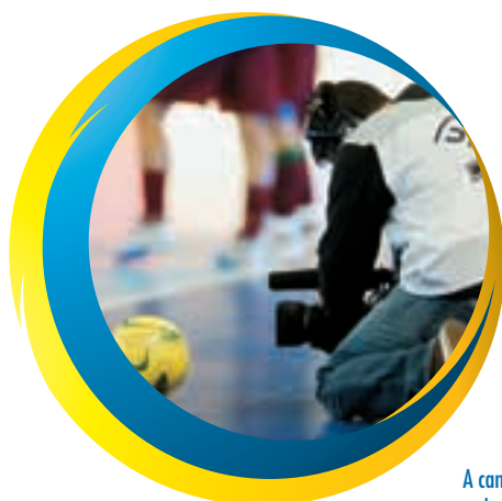
A cameraman keeps a close eye on the ball during the opening match between Portugal and Italy.