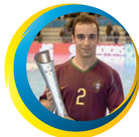
Ricardinho, one of three players to win the Man of the Match award twice, lifts the Carlsberg trophy after scoring two of Portugal's three goals against Romania.