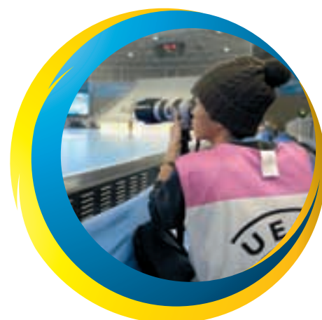
No fewer than 48 photographers were accredited for the final tournament in Portugal.