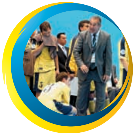
Der erfahrene ukrainische Trainer Gennadiy Lysenchuk gibt seinen Spielern während der 2:3-Niederlage gegen Serbien Anweisungen.