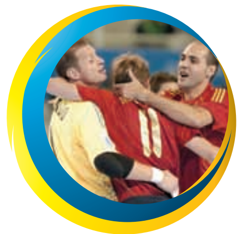
Spanish captain Javi Rodríguez (right) is congratulated by Marcelo and goalkeeper Luís Amado after scoring his side's third goal during the final against Italy.