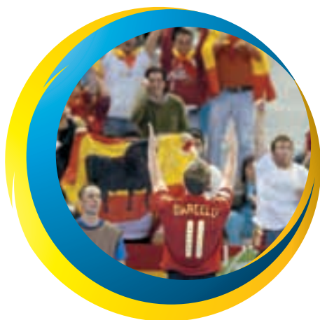
Here's looking at you! Marcelo salutes the Spanish supporters after nudging home Alvaro's lob to put Spain 1-0 ahead in the final against Italy.