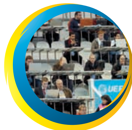
The Ukraine v Russia game left a few empty seats in the Press Box at the Coração de Ouro pavilion in Gondomar. But for most games it was filled to capacity.