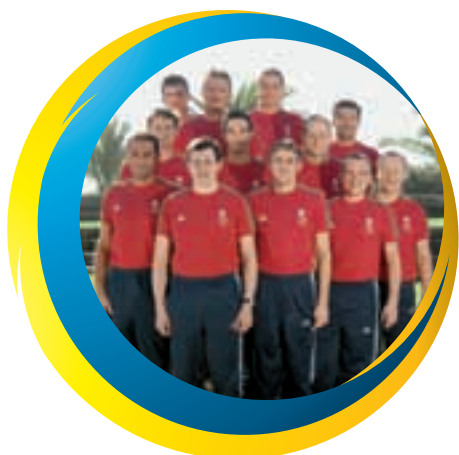
The ninth squad at the final tournament in Portugal lines up for the team photo.