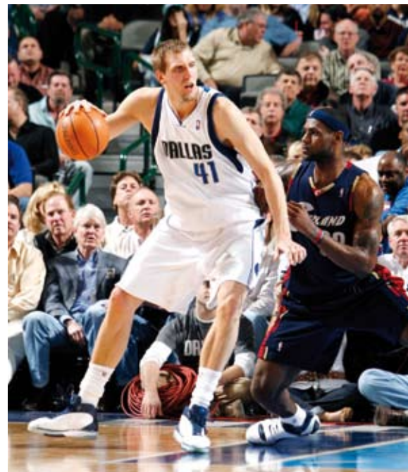
KORBJÄGER Der Würzburger Dirk Nowitzki von den Dallas Mavericks ist ab Ende Oktober zu sehen.

Auch außerhalb des Live-Sports hat vod.premiere.de einiges zu bieten. Von adrenalineladener Action bis hin zum Dokumentarfilm sind in der Online-Videothek eine Vielzahl an Programmangeboten aus den unterschiedlichsten Genres abrufbar. Zu den Top-Movies im Oktober gehören „Das Parfum“ oder die preisgekrönte urbayrische Komödie „Wer früher stirbt ist länger tot“. Schürzenjäger-Fans kommen noch einmal in den Genuss des Abschiedskonzerts der Kult-Band aus