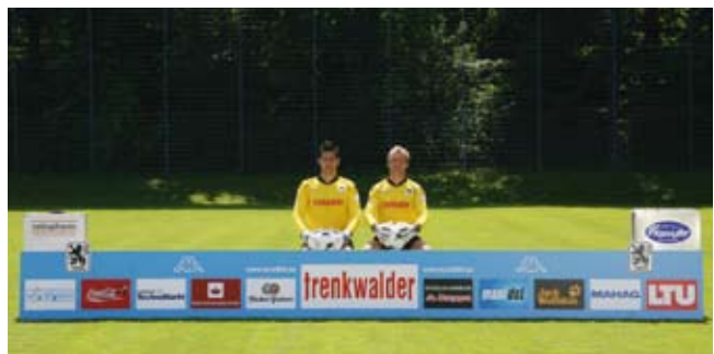
„... SEHR VIELE freie Stellen ...“