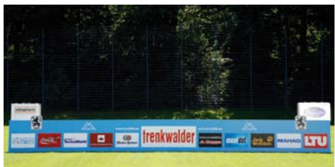
„... Lassen Sie sich von Trenkwalder einwechseln – in Ihren neuen Job!“