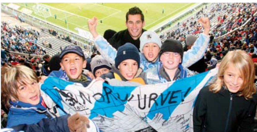
Merkur CUP 2007