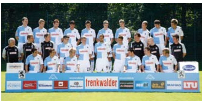
„... auch genau IHRE Stelle ist noch frei ...“