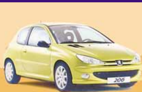
Abbildung enthält Sonderausstattung

€ 9.990,- Barpreis für den 206 Pop Art inkl. KLIMANLAGE