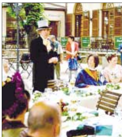
Das Hochzeitsmahl im „Burgkeller“