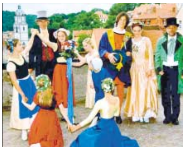
Tanzspiel „Ringelreihen“ nach Gemälde Ludwig Richters