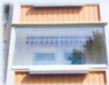
die rahmenlose Ganzglas-Balkonverglasung mit Faltsystem