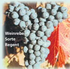
Weinrebe Sorte Regent