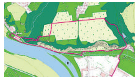
Weinstrecke des Bombastus Nordic Walking Zentrums Meißen mit Startpunkt neben Maroc's Bowling