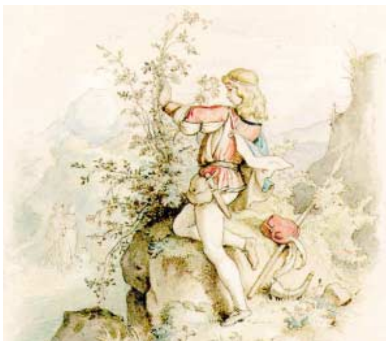
Und der wilde Knabe brach's Archiv Porzellan-Manufaktur Meissen

anlässlich des 200. Geburtstages von Ludwig Richter (1803–1884)