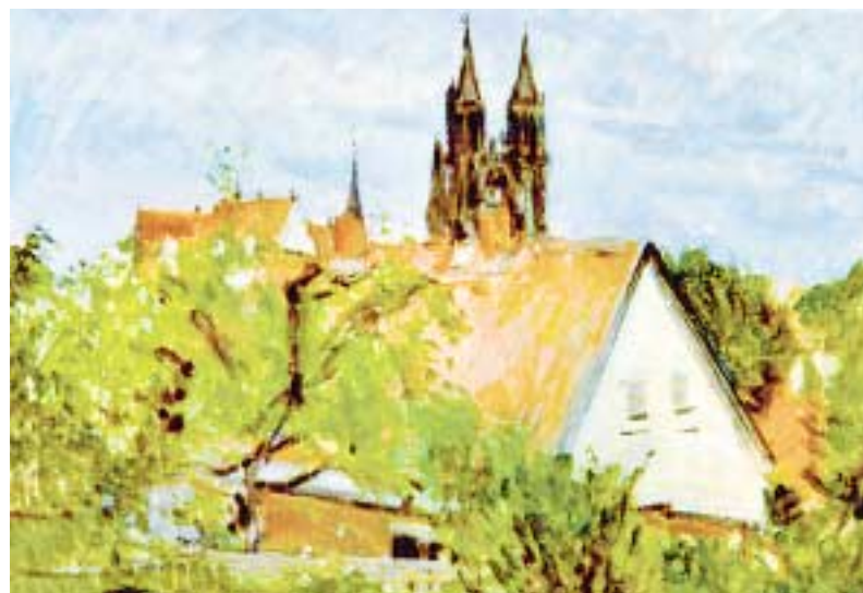
Meißen – vom Schottenberg gesehen „Ein schöner, guter Geist über dem Wirklichen als neue Wirklichkeit...“ Ulrich Jungermann

Stadtgalerie des Kunstvereins „Romantik – modern“ vom 02.11.2003–03.01.2004 geöffnet