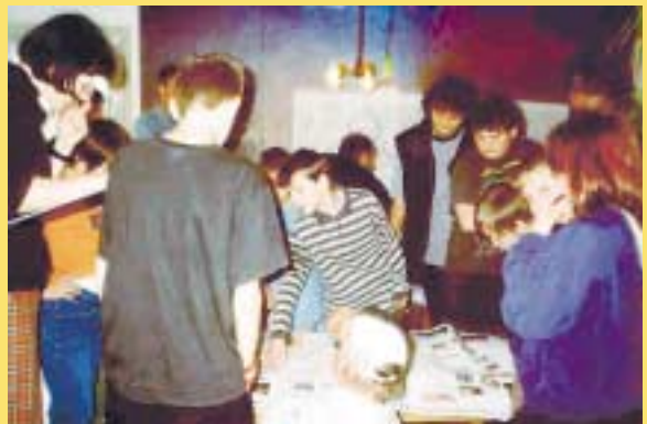
Planerwerkstatt im Kinderschutzbund