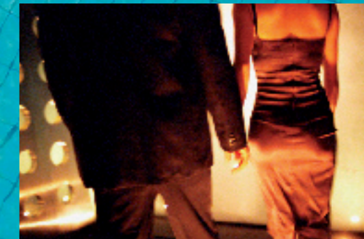
PARTNERWAHL Wie Frauen den Männern die Illusion ermöglichen, sie würden entscheiden

Erhältlich im ausgewählten Buch- und Zeitschriftenhandel oder unter www.geo.de