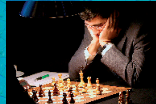
STRATEGIE Weshalb auch die besten Denker nicht auf ihre Intuition verzichten können