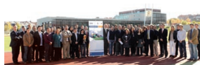
Alumnos de la 1ª Edición del Curso Superior Universitario en Gestión Deportiva con el Presidente de la RFEF, Ángel María Villar, y la Copa del Mundo alcanza en Sudáfrica en Julio de 2010.