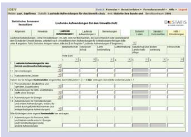
Online-Formular Laufende Aufwendungen für den Umweltschutz

Sie haben auch die Möglichkeit anderweitig erstellte Dateien in ein IDEV-Formular „einzulesen“, sie dort anzusehen, ggf. nachzubearbeiten und danach an Ihr statistisches Amt zu übermitteln. Hierbei steht Ihnen der volle IDEV-Service – von Vorprüfungen bis zu statistikspezifischen Online-Hilfen – zur Verfügung.