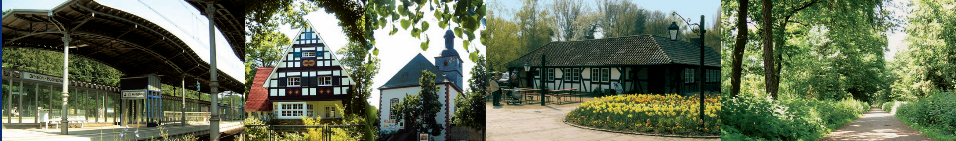
Start- und Zielpunkt: Bahnhof Buchschlag 1 Wohnhaus in der Villenkolonie Buchschlag 2 Sprendlingen: Erasmus-Alberus-Kirche 4 Am Gut Neuhof 5 Waldweg zwischen Gut Neuhof und Hofgut Patershausen