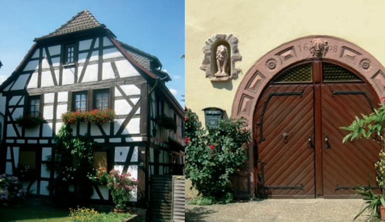
7 Altstadt Dreieichenhain: Fachwerkhaus, Fahrgasse ▲ Untertor ▼