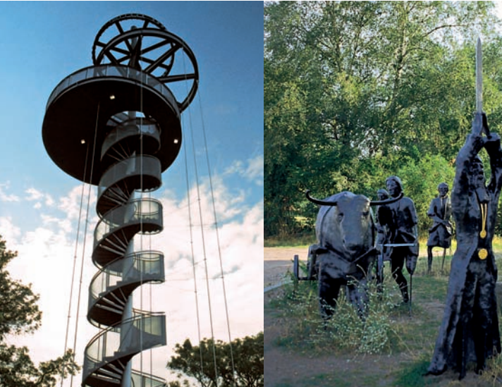
Aussichtsturm am Wingersberg Auf der Bulau: Keltische Begräbniszeremonie