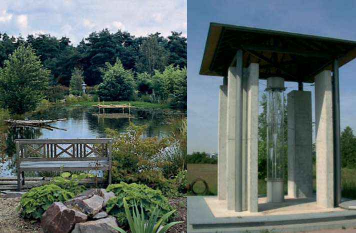
Internetpark (Wörnerpark) Wasserwerkpark