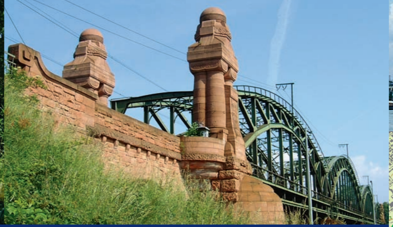
1 Hochheimer Eisenbahnbrücke ▲