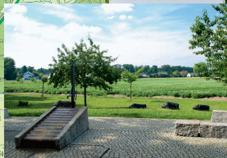
7 Nauheim: Klanginstallation ▲

„Sauunter im Blech“ In früheren Zeiten wurden hier Schweine, die tagsüber auf Waldweiden gehalten wurden, nachts in einem speziellen Gatter untergestellt. Daher der Gemeinname „In der Sauunter“. Pate für die Gestaltung der Brunnenanlage standen Geschichte und Wappen der Gemeinde Nauheim. Das Waschbrett, der Brunnenstein, ist aus einem Granitblock gehauen. Das Wasser fließt in ein Becken mit der Kontur eines Waschbleuels. Waschbleuel diente früher zum Weichklopfen der nassen Wäsche. Im Siegel der Gemeinde wird er seit dem 17. Jahrhundert verwendet. Nach dem Waschen wurden die Waschelaken auf den Wiesen ausgebreitet, um sie in der Sonne zu bleichen.