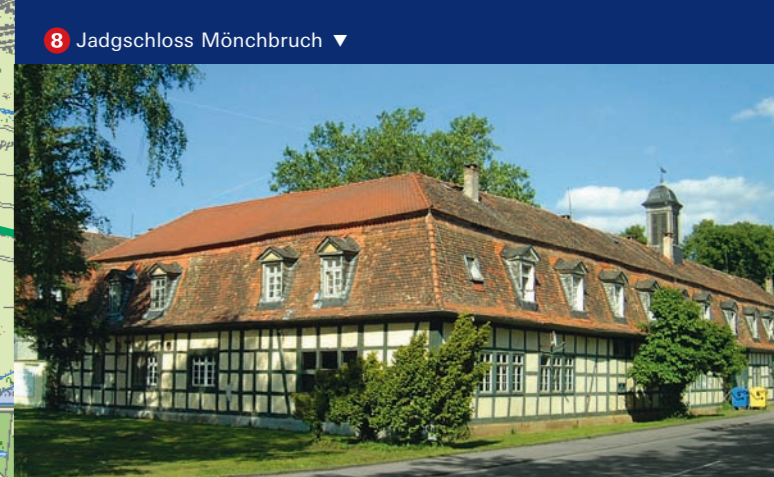
8 Jagdschloss Mönchbruch ▼

RMV-Mobilitäts-Beratung RMV-Hotline (3,9 Cent/Minute)* 01801/768 4636 Internet www.rmv.de *aus dem dt. Festnetz; Mobilfunkpreise anbieterabhängig, max. 42 Cent/Minute Beratung vor Ort RMV-Mobilitätszentralen