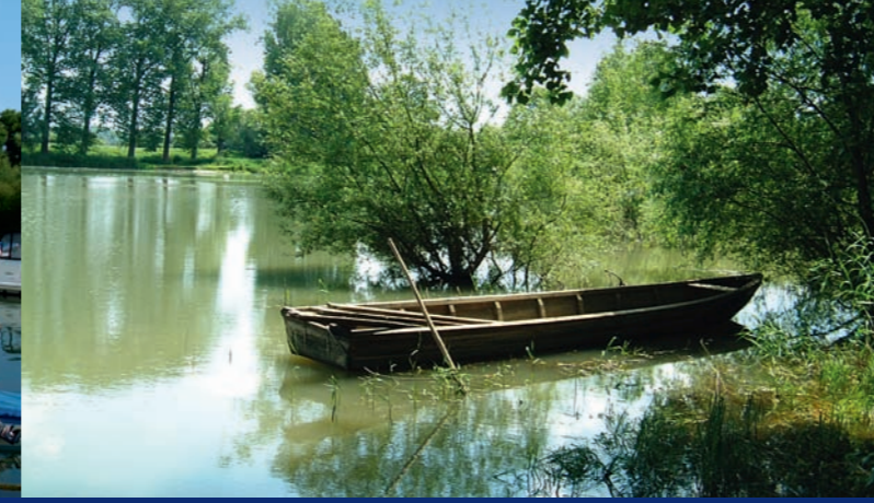
4 Nonnenau: Altrheinarm ▲