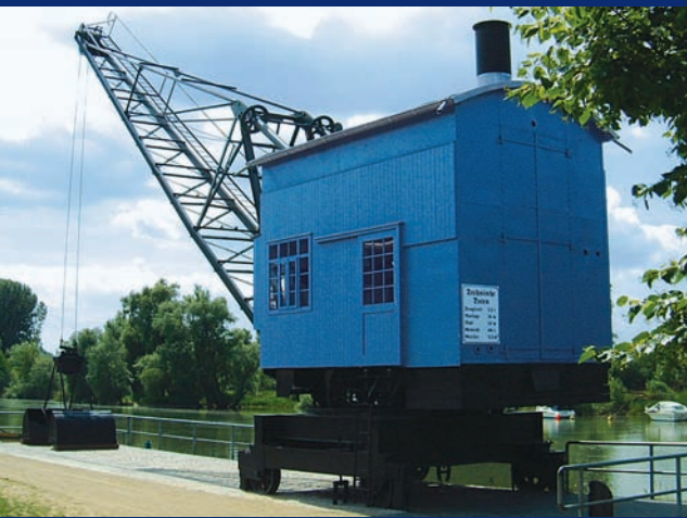
3 Ginsheimer Altrheinufer: Kran ▲