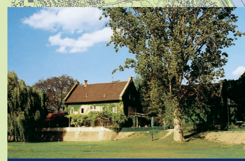
4 Nonnenau: Hofgut Langenau ▲