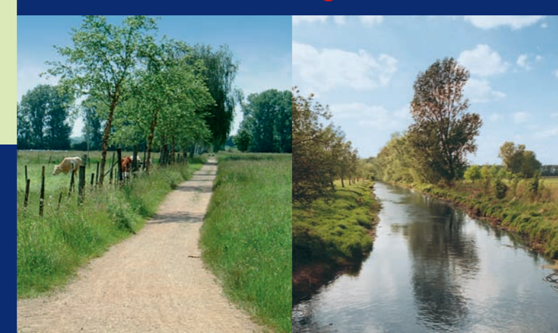
Wolvenweide in Trebur ▼