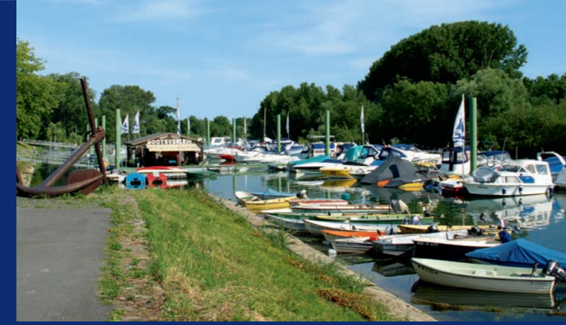
3 Ginsheimer Altrheinufer: Sportboothafen ▲

Hessen mit dem Rad entdecken: Unterwegs zwischen Mainspitze und Mönchbruch (46 km)