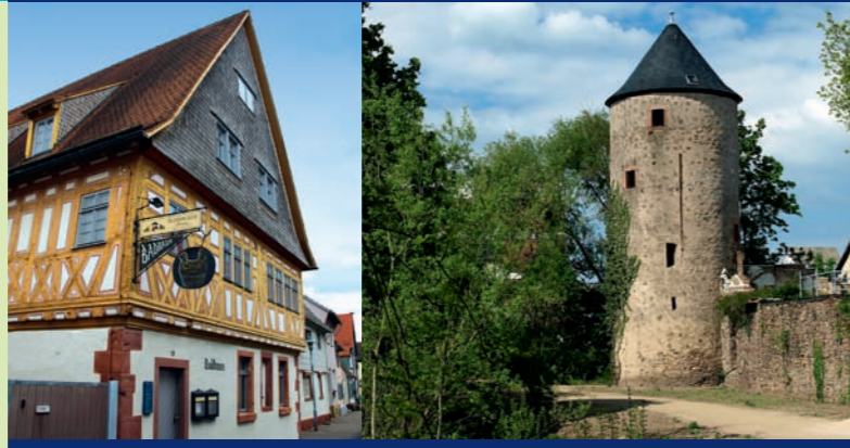
1 Dieburg: Badhaus ▲ 1 Dieburg: Mühlenturm ▲