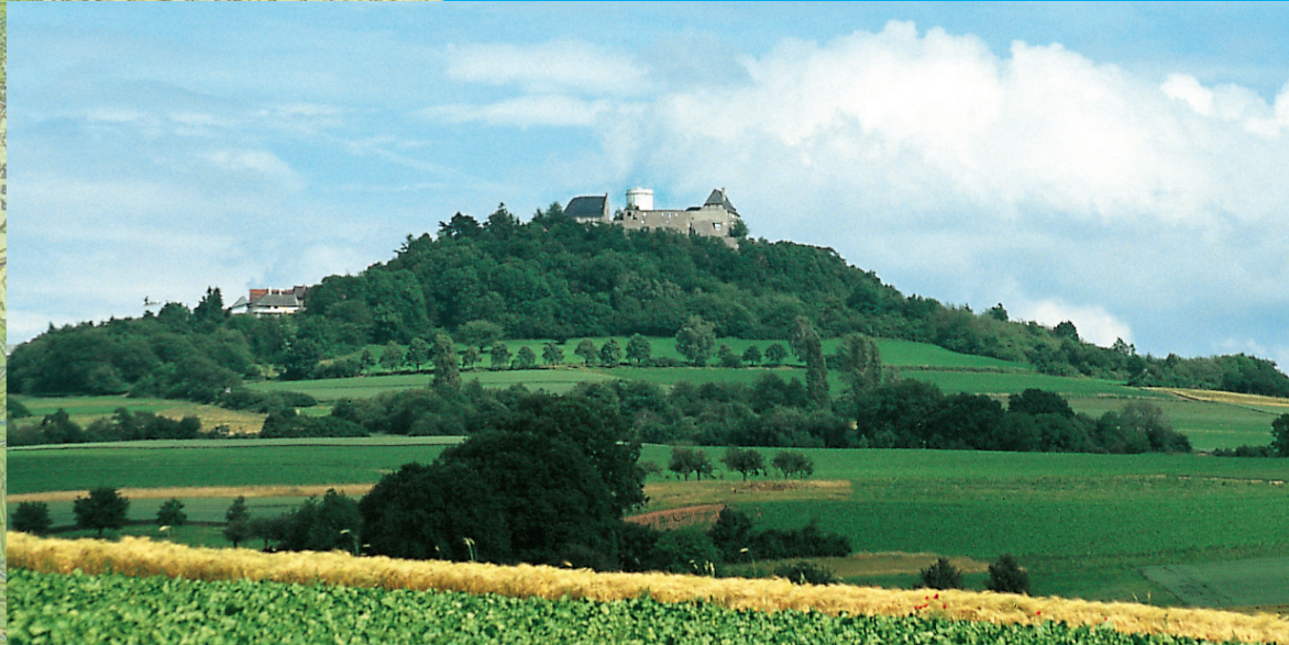
5 Babenhausen Langstadt: Neugotische Kirche ▼ 3 Veste Oitzberg ▲