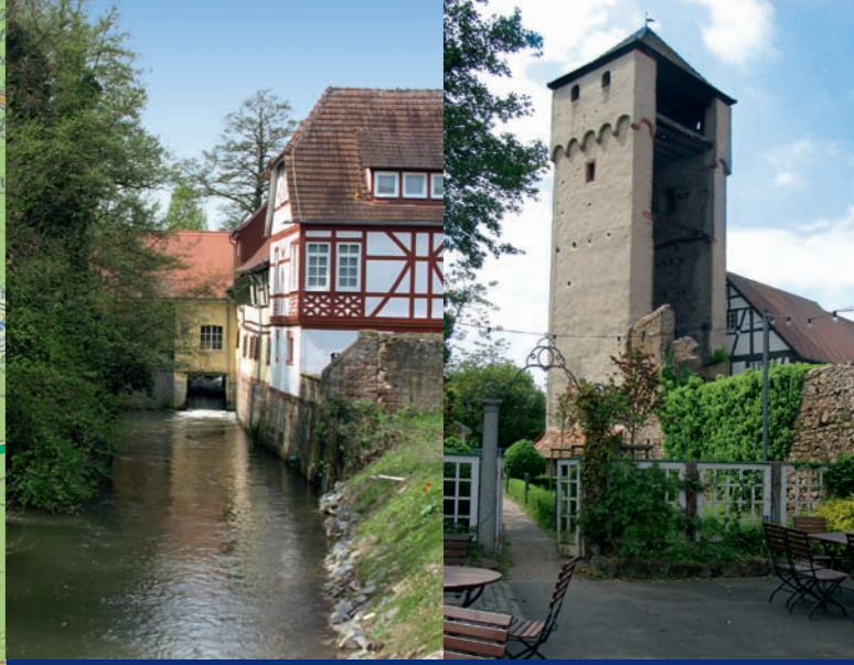
5 Babenhausen: Stadtmühle ▲ 5 Babenhausen: Hexenturm ▲