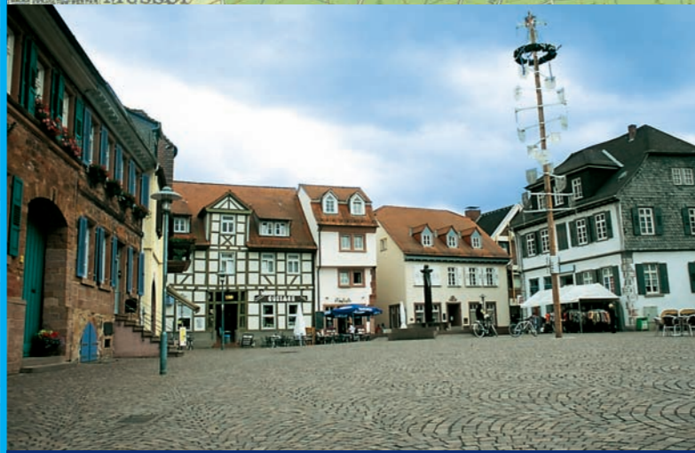
1 Dieburg: Marktplatz ▲