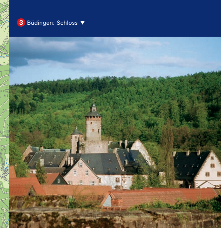
3 Büdingen: Schloss ▼