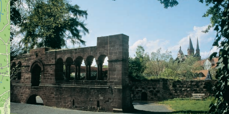
1 Gelnhausen: „Barbarossaburg“ ▲