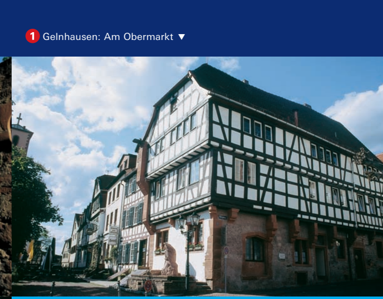
1 Gelnhausen: Am Obermarkt ▼