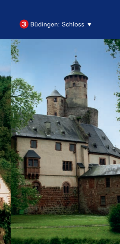
3 Büdingen: Steinernes Haus ▼