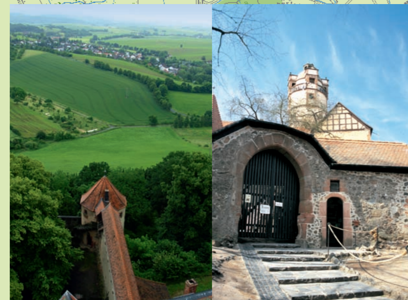
5 Blick von der Ronneburg ▲