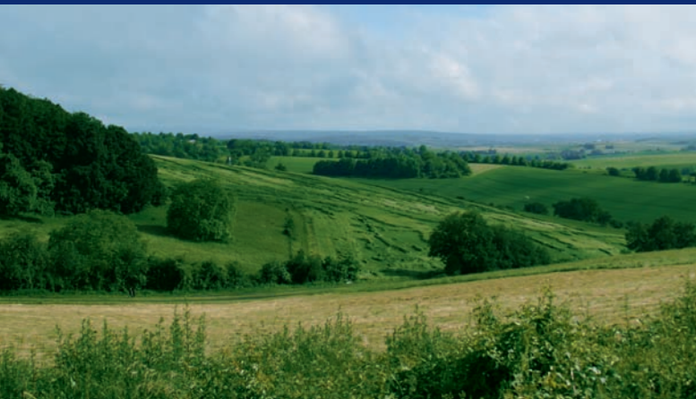
5 Blick von der Ronneburg ▲