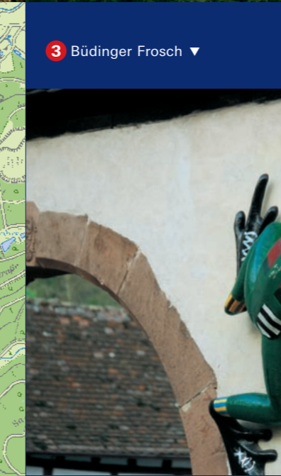
3 Büdingen: Frosch ▼