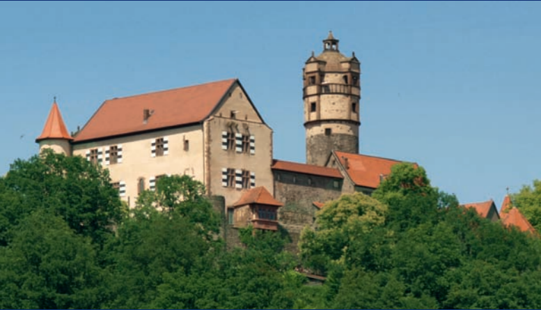
5 Burg Ronneburg ▲