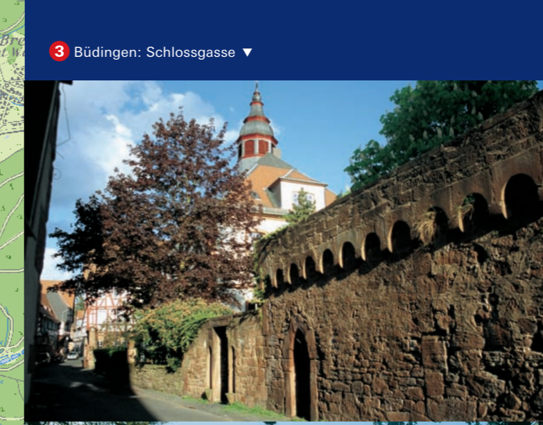
3 Büdingen: Schlossgasse ▼