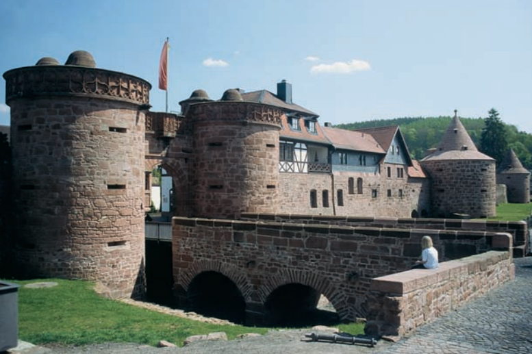
3 Büdingen: Jerusalem Tor ▲