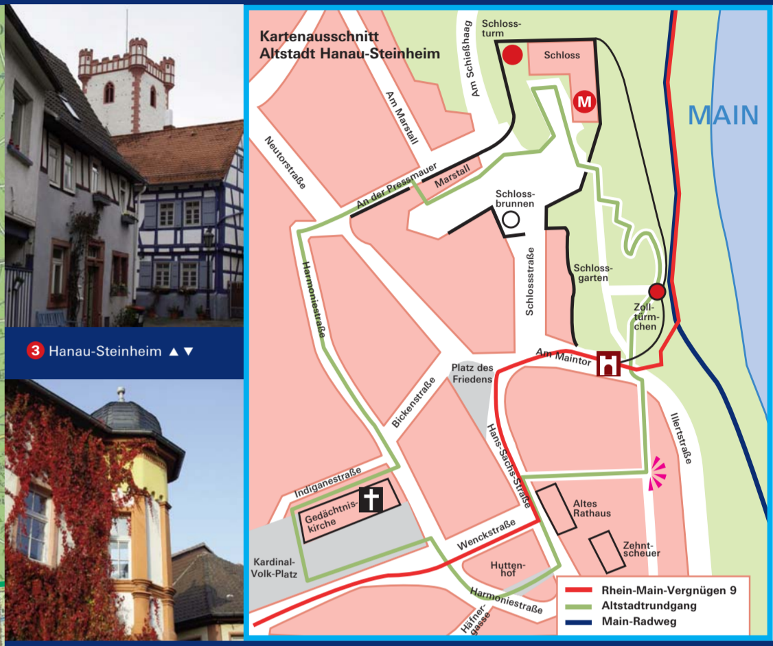
3 Hanau-Steinheim ▲▼ 1 Seligenstadt: Marktplatz ▼ 1 Seligenstadt: Ehemaliges Benediktinerkloster mit Landschaftsmuseum ▼