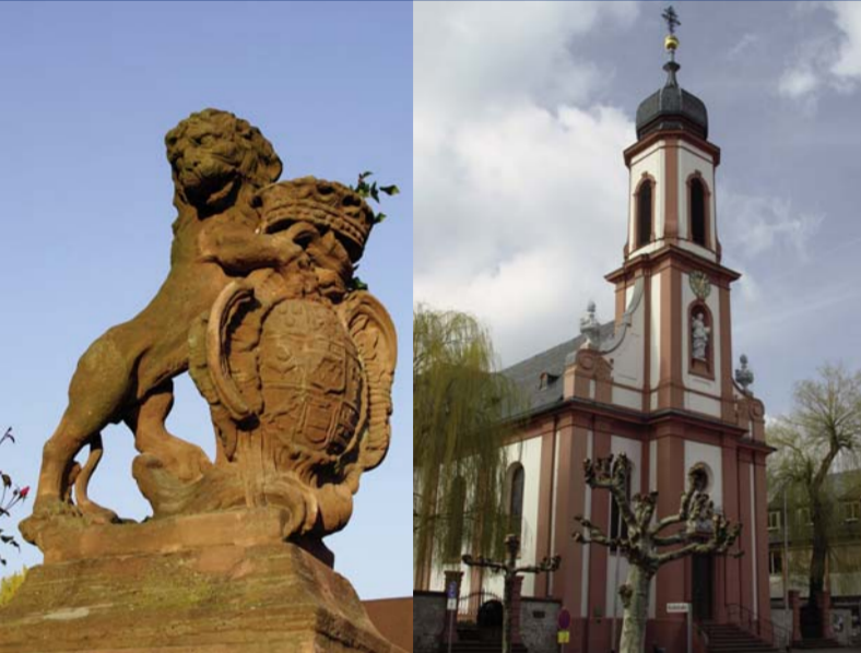
6 Heusenstamm: Schloss Schönborn ▲ 6 Heusenstamm: Barockkirche St. Cäcilia ▲