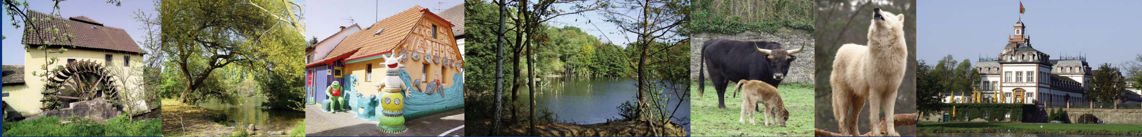
5 Mühlheim: Brückenmühle ▲ Am Main ▲ 5 Mühlheim-Dietesheim: Kinderhaus ▲ 4 Dietesheimer Steinbrüche ▲ 2 Hanau-Klein-Auheim: Alte Fasanerie (Auerochse, Polarwolf) ▲ Hanau: Schloss Philippsruhe ▲