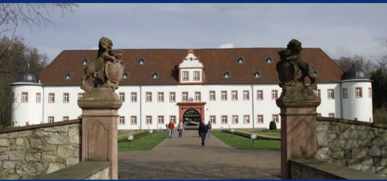
6 Heusenstamm: Schloss Schönborn ▲