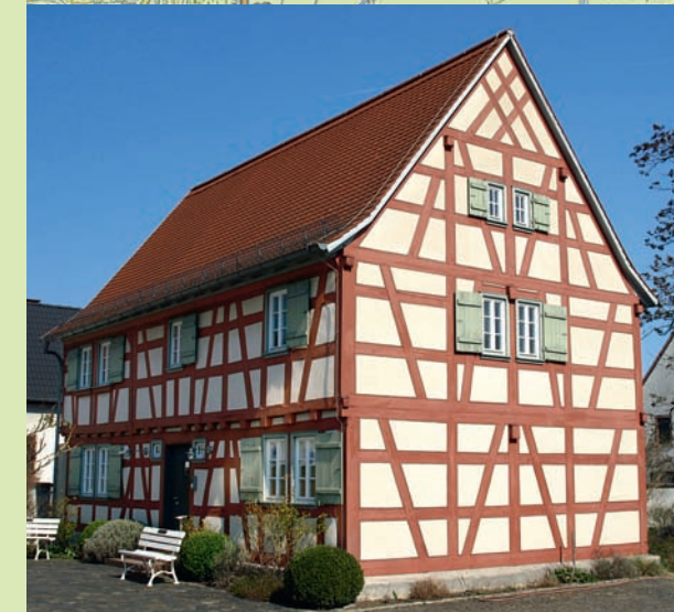
Riedstadt-Goddelau: Büchnerhaus ▲