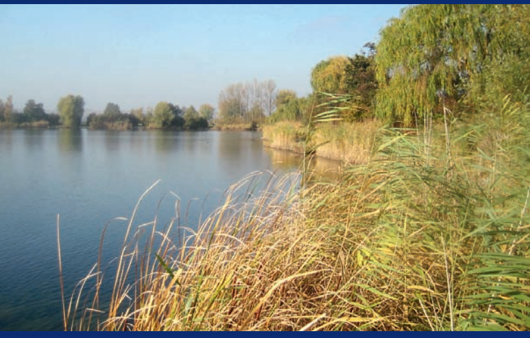
Trebur: Oberwiesensee ▲