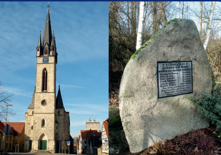
Trebur-Geinsheim: Kirche ▲ Trebur-Kornsand: Gedenkstein ▲