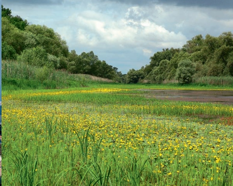
3 Kühkopf: Seekannenblüte ▲