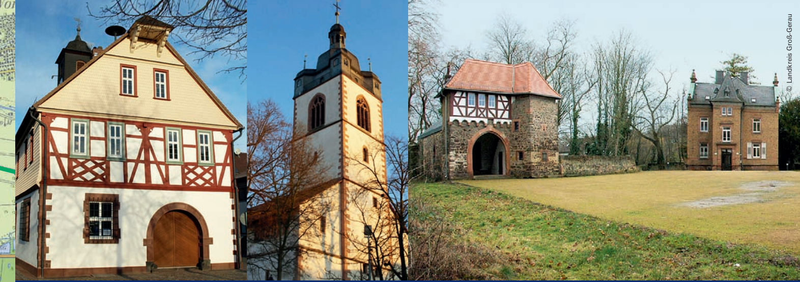
1 Trebur: Altes Rathaus ▲ 5 Groß-Gerau: Stadtkirche ▲ 5 Groß-Gerau-Dornheim: Schloss ▲