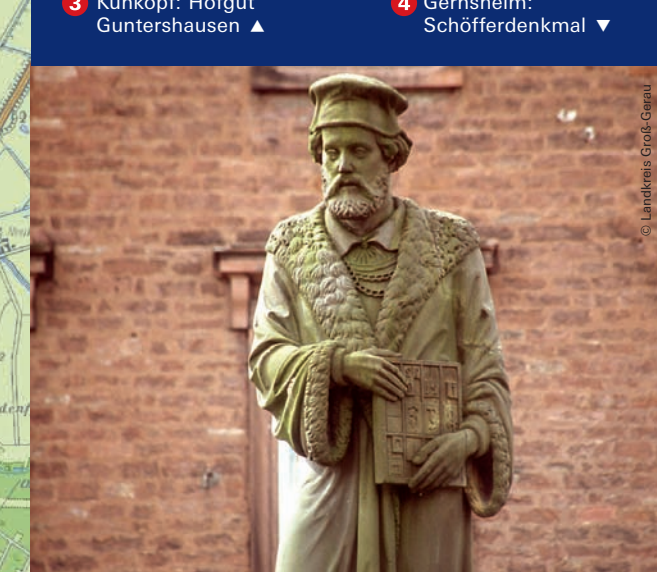
4 Gernsheim: Schöfferdenkmal ▼