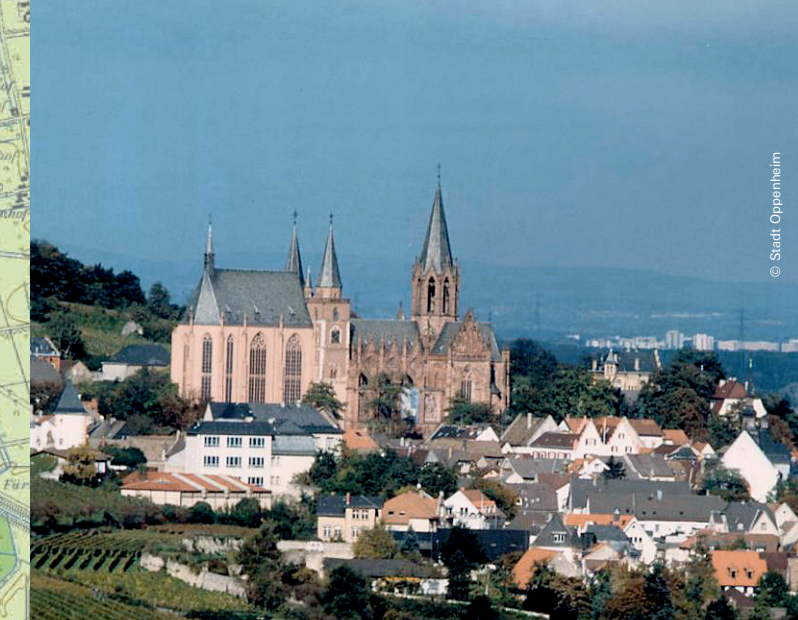
2 Oppenheim: Katharinenkirche ▲