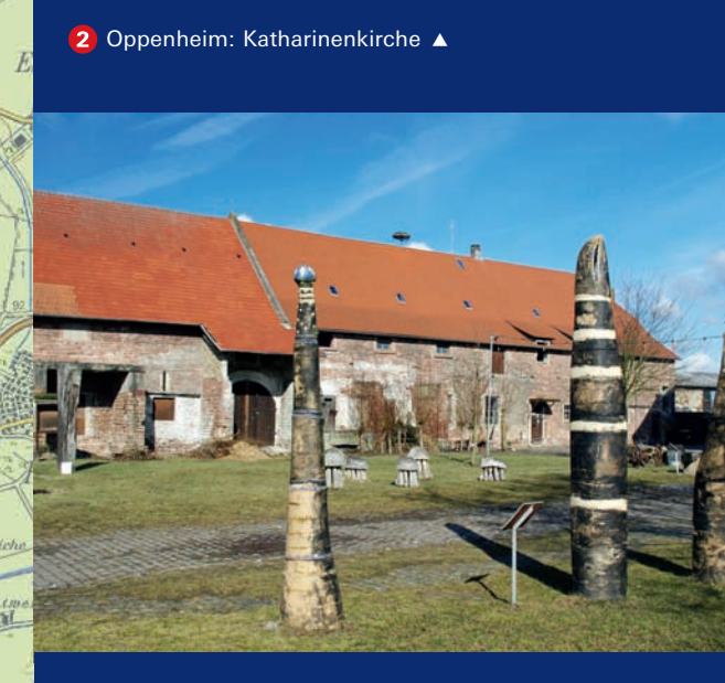
3 Kühkopf: Hofgut Guntershausen ▲