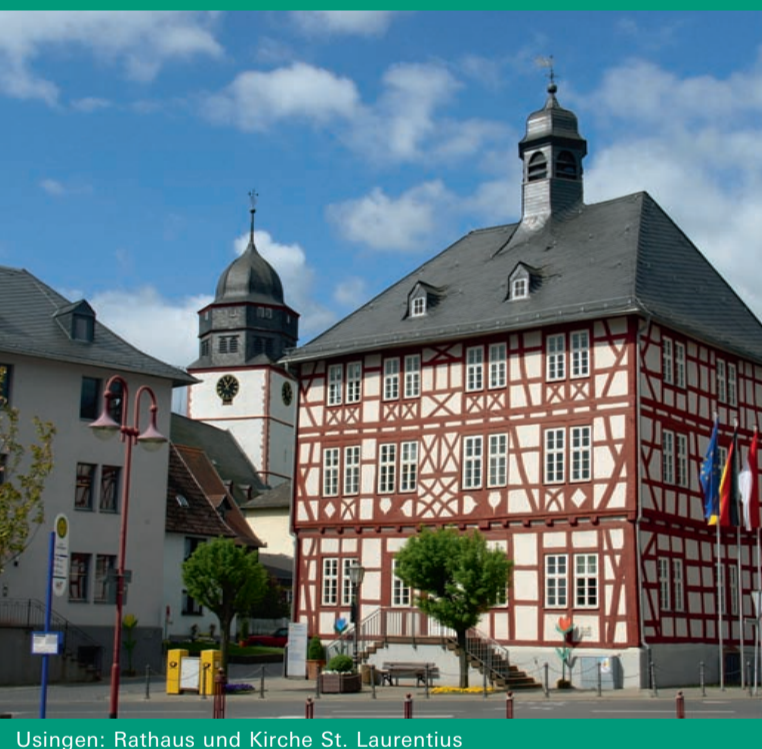
Usingen: Rathaus und Kirche St. Laurentius (RMV-Routen 1 und 5)