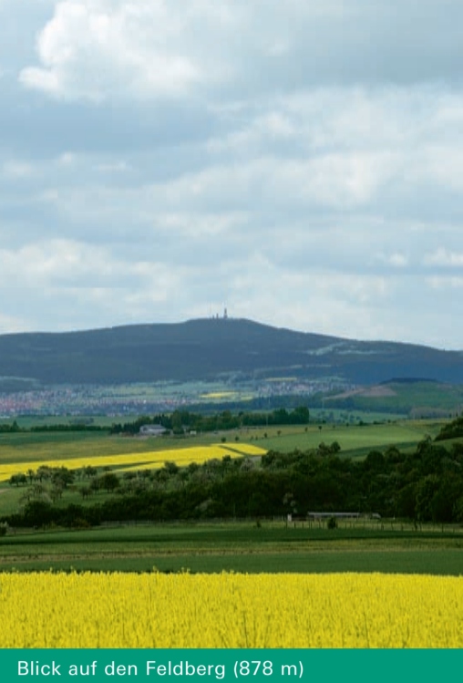
Blick auf den Feldberg (878 m)

Hessen zu Fuß entdecken: Hochtaunus, Karte Nord Entlang der Taunusbahn zwischen Brandobberndorf und Neu-Anspach