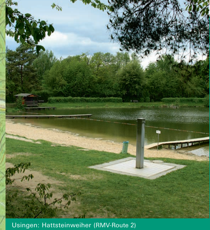
Usingen: Hattsteinweiher (RMV-Route 2)