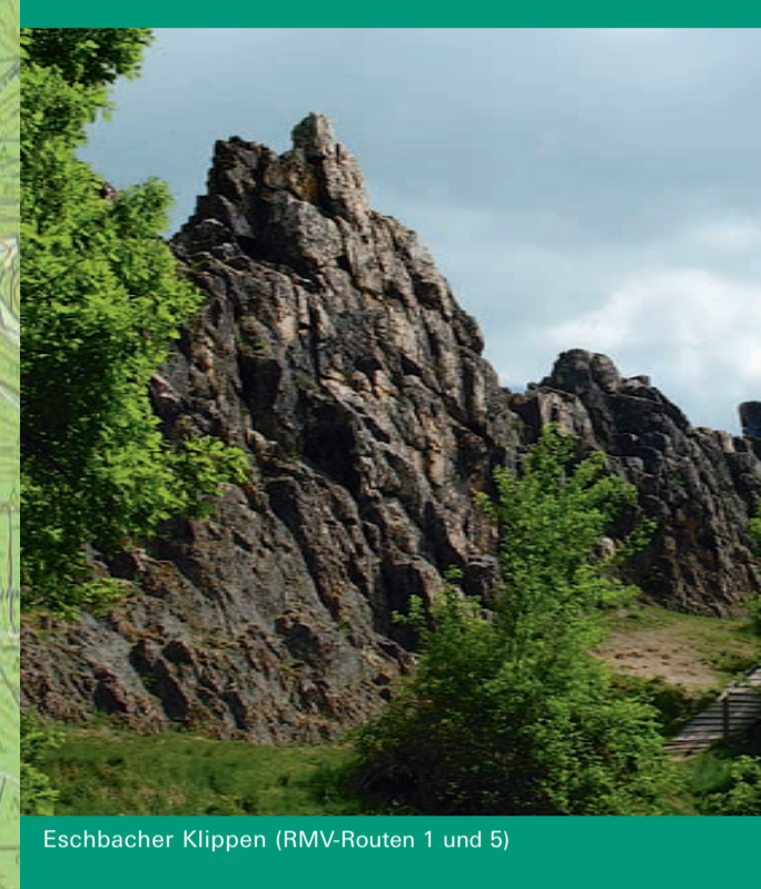
Eschbacher Klippen (RMV-Routen 1 und 5)