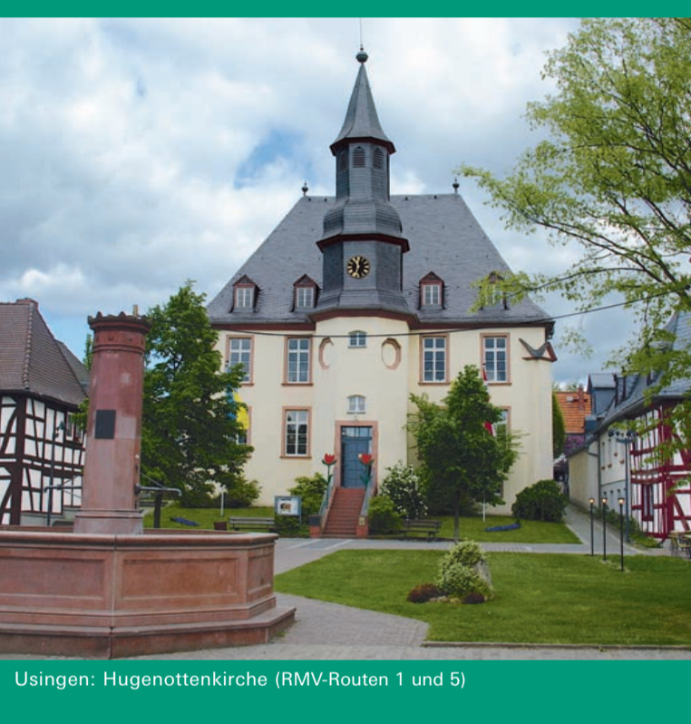
Usingen: Hugenottenkirche (RMV-Routen 1 und 5)