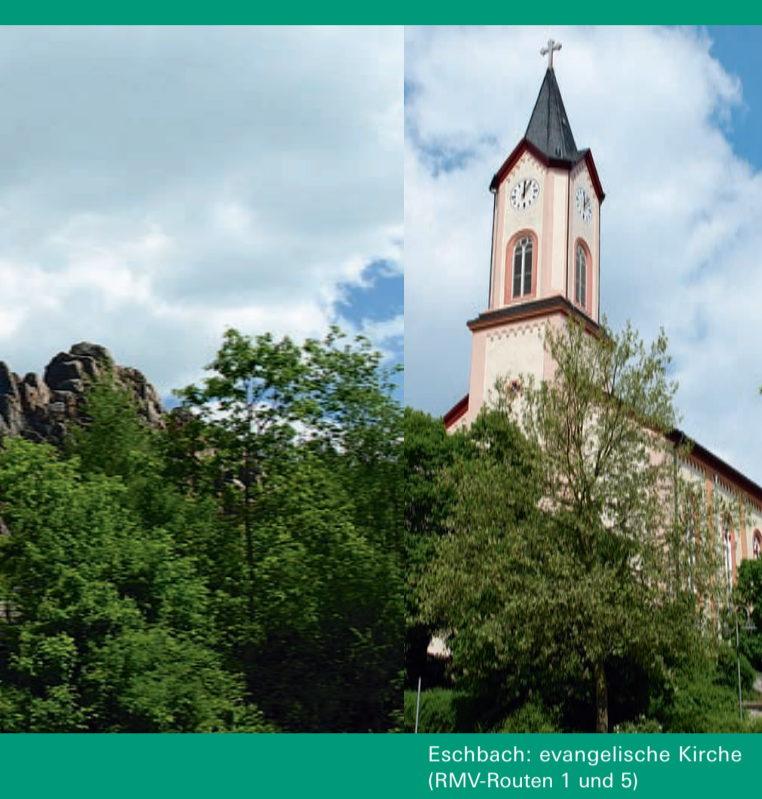
Eschbach: evangelische Kirche (RMV-Routen 1 und 5)