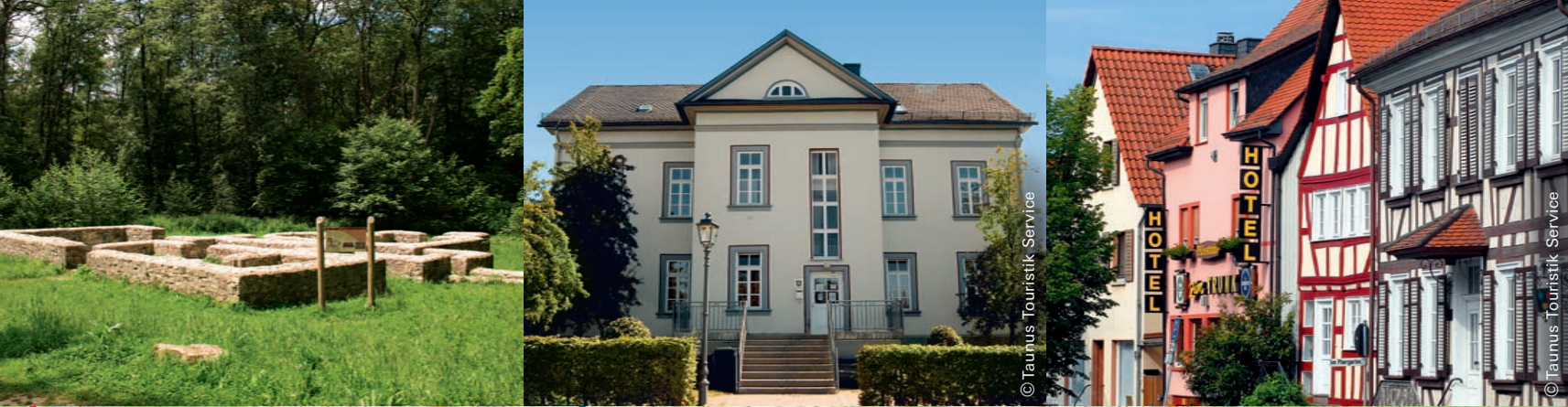
Links: Kapersburg (RMV-Route 2)

Hessen zu Fuß entdecken: Hochtaunus, Karte Süd Entlang der Taunusbahn zwischen Usingen und Bad Homburg