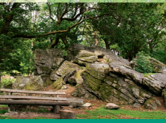
Marmorstein (RMV-Route 6)