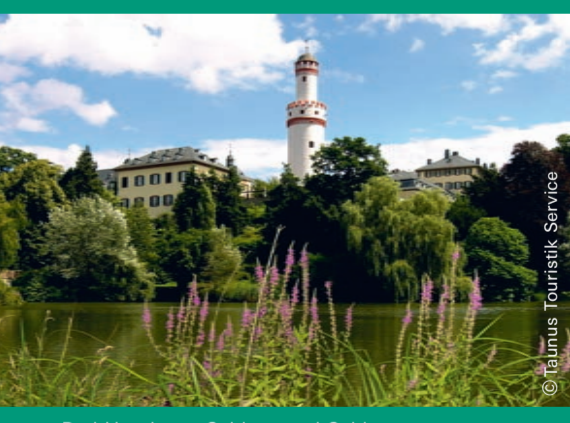
Bad Homburg: Schloss und Schlossgarten (RMV-Routen 1, 2 und 6)