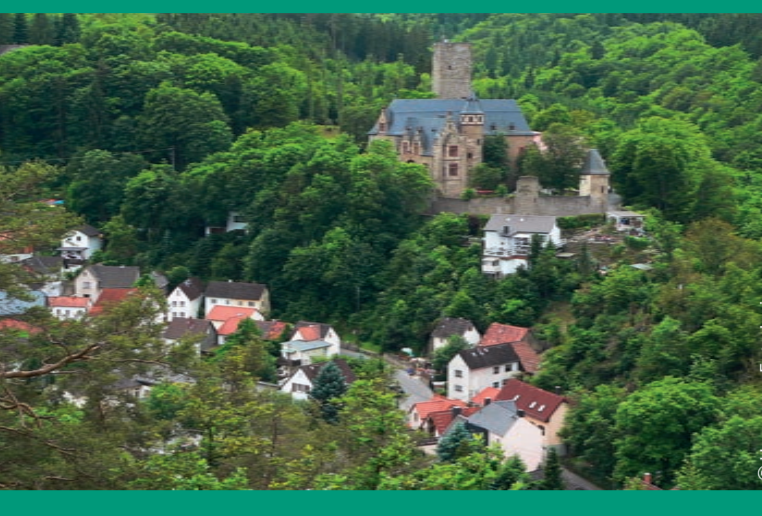
Schloss Kransberg (RMV-Route 2)