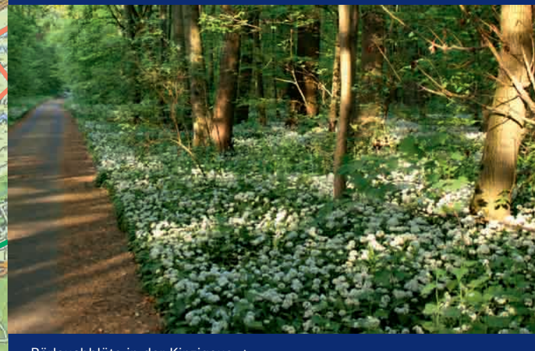
Bärlauchblüte in der Kinziguaue ▲