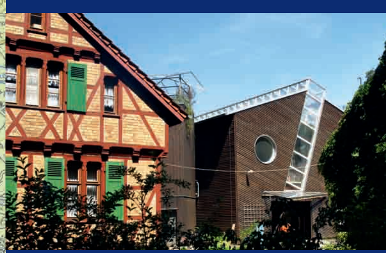
Forstamt Hanau-Wolfgang: Samendarre ▲