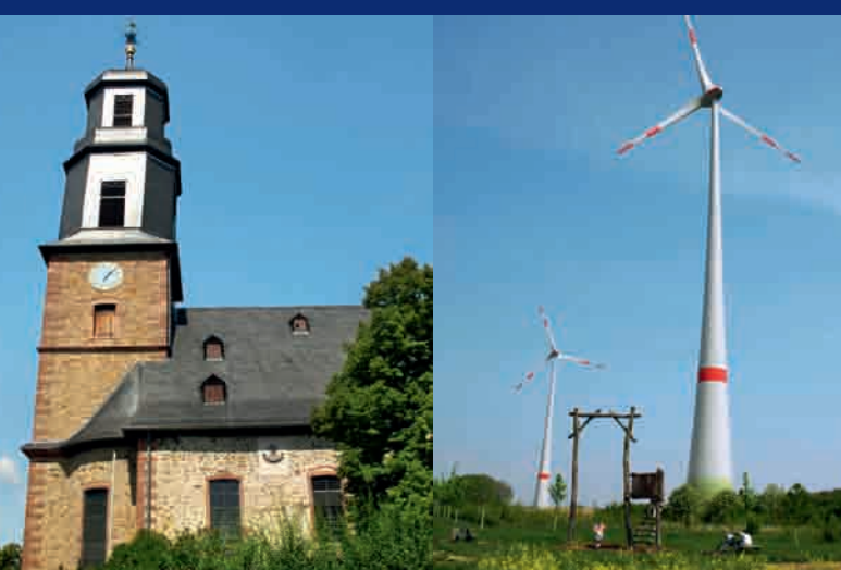
Rodenbach: Ev. Pfarrkirche ▲