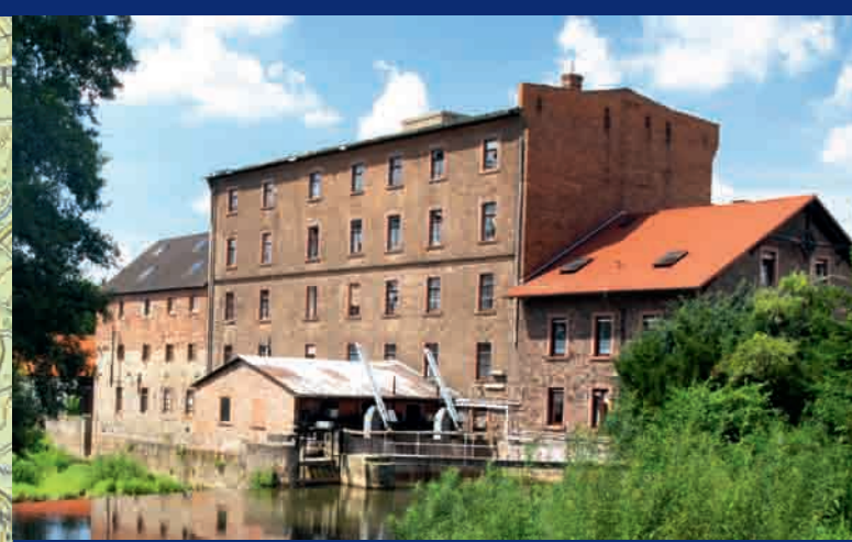
Erlensee-Rückingen: Alte Mühle ▲