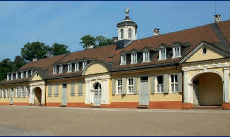
4 Staatspark Wilhelmsbad ▲