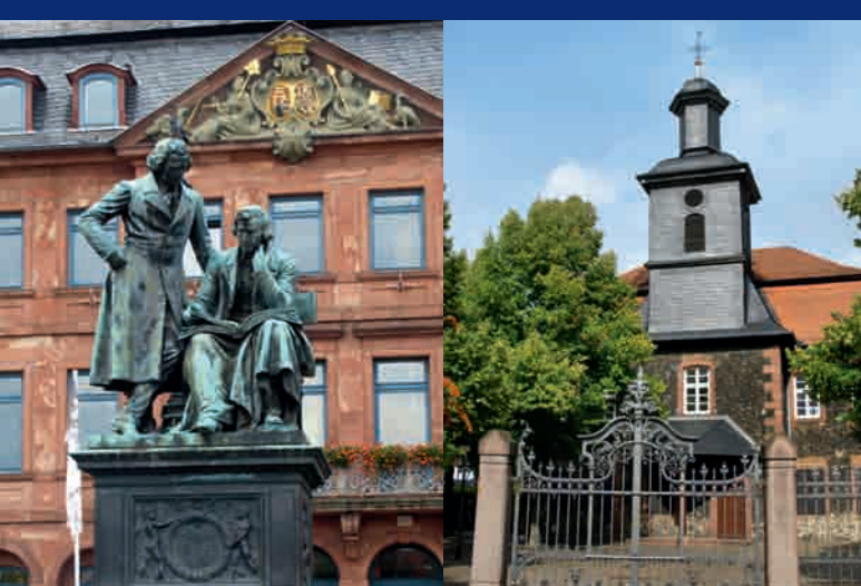
1 Hanau: Brüder-Grimm-Denkmal ▲