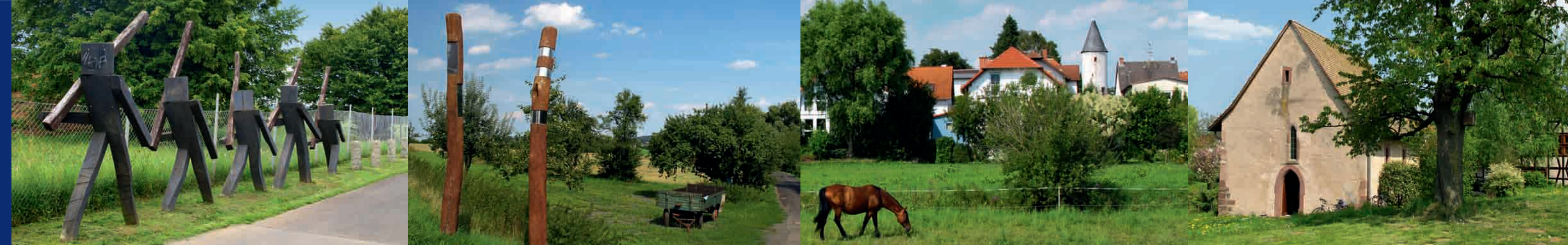
5 Hohe Straße: Wartbaum ▲ Bei Hammersbach-Hirzbach ▲ Bei Hammersbach-Marköbel ▲ Hohe Straße: Hammersbach-Hirzbach, Marienkapelle ▲

Hessen mit dem Rad entdecken: Unterwegs zwischen Hoher Straße und Kinzig (52 km)